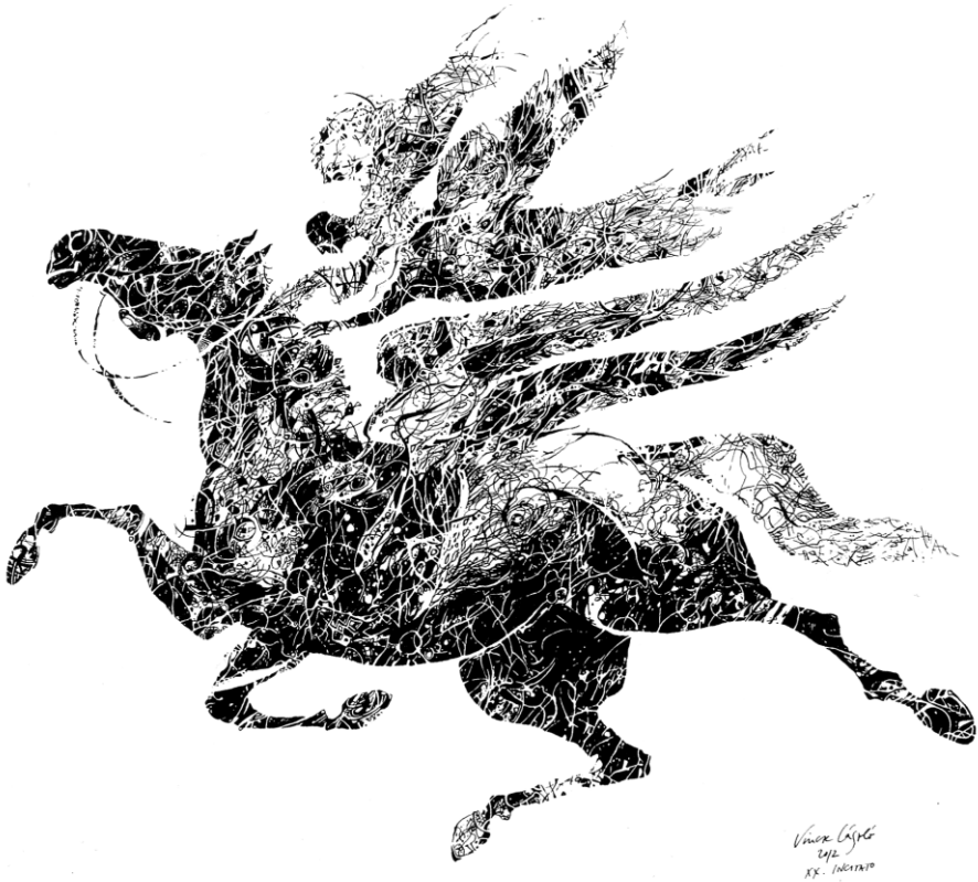
VINCZE LÁSZLÓ: MENNYEI LÓ (TOLL, TUS)