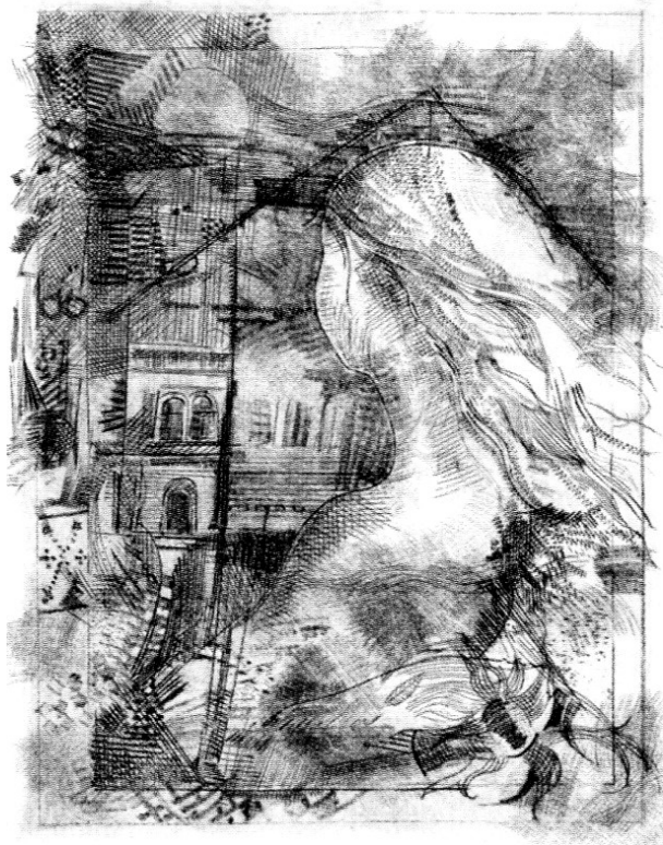
FEHÉR CSABA: FÜREDI ANZIX (VEGYES TECHNIKA)