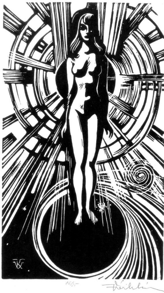
VÁRKONYI KÁROLY: FÉNYRE (LINÓMETSZET)

Utolsó megjegyzésként szóvá kell tennünk, hogy a kiadó szerkesztéssel megbízott munkatársa a szöveg alaposabb gondozásával könnyíthetett volna a befogadóra várakozó feladaton.