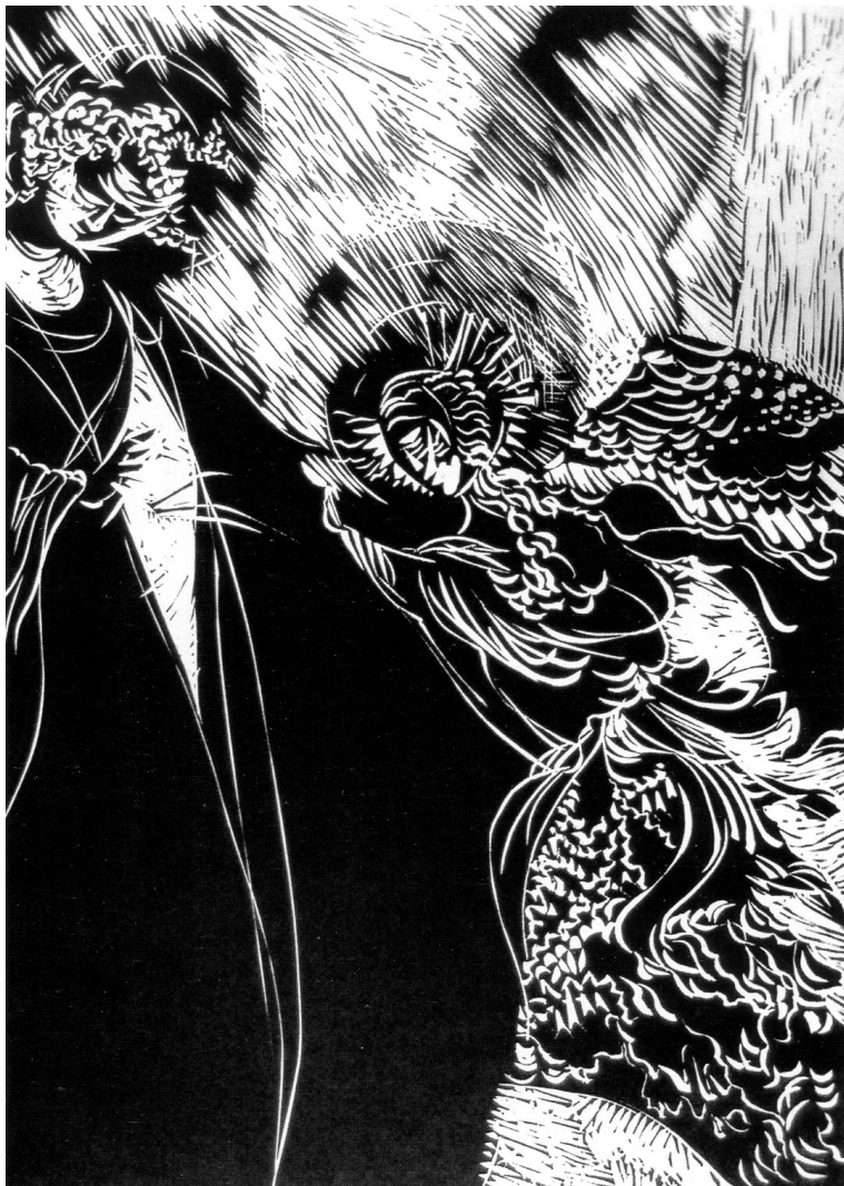
SUBICZ ISTVÁN: ANGYALI ÜDVÖZLET (LINÓMETSZET)

VITÉZ Ferenc (2015): Comenius és a grafika. Értelmezési perspektívák a képes (nyelv)tankönyvtől, az emblemikus vilásképzőpályán keresztül, a „beavató” labirintuskönyvig. In: FÖLDY Ferenc, KONCZ Gábor, KOVÁTS Dániel (szerk.): Comenius és szellemi örökösei. Bibliotheca Comeniana XVIII. Magyar Comenius Társaság, Sárospatak, 117–134.