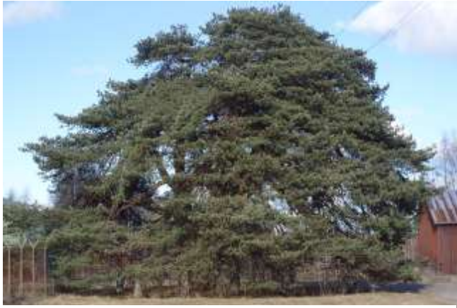
Kuva 4. Keisarinmänty. Terho Marttila 2012.

Ihmiset liikkuvat vähemmän luonnossa, kaupungeissa ei näe yöllistä tähtitaivasta ja kollektiiviset rituaalitkin ovat vähentyneet. 161 . Siitä huolimatta ihmisten riippuvuus luonnosta jatkuu ja jopa voimistuu. Euroopan kaupungeissa on nähtävissä paluumuuttoa maalle siksi, että kaupungeista puuttuu viheralueita.