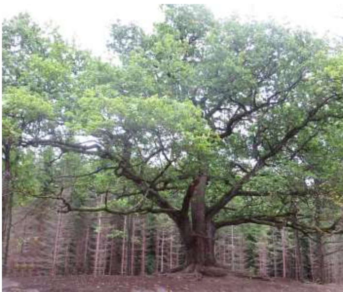
Kuva 3. Lohjansaaren Paavolan tammi. Terho Marttila 2016.

Nykyään, sosiaalisen median aikakaudella, elämysmatkailu ja -retkeily ovat nostaneet suosiotaan. Mielenkiintoisia elämyksiä tuottavien kohteiden, mukaan lukien myös luonnonmuistomerkkien, tiedot leviävät sosiaalisessa mediassa harrastajien kesken kulovalkean tavoin. Ilmiössä on kyse siitä, että samanlaisia kokemuksia arvostavat ihmiset linkittyvät keskenään ja tieto hienosta luontokohteesta tavoittaa hetkessä suuren joukon ihmisiä – kohdetta saattaa tulla katsomaan suurempi joukko harrastajia kuin koskaan aikaisemmin. Tästä hyvänä esimerkkinä on Lohjansaaren Paavolan tammi.