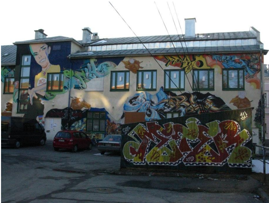
Kuva 2: Näkymä kulttuuritalo Annankatu 6:n sisäpihalta

Tutkimusprosessi sai alkunsa tammikuussa 2012, kun esittelin luovaa tilaa koskevan aiheen maisemantutkimuksen graduseminaarissa. Alkuinnostuksen jälkeen en kuitenkaan saanut otetta aiheesta ja luovan tilan tutkiminen siirtyi hiljalleen tutkimukseni taustalle. Halusin tarkastella paikan kokemista ja kokemusten liittymistä annislaisten eli kulttuuritalon aktiivikäyttäjien elämään. Täten tutkimukseni kehittyi koskemaan paikan elämäkerrallista kokemista. Teoreettisemmasta näkökulmasta katsottuna minua kiinnosti paikkaan liittyvä ristiriitaisuus ja kategorisoinnin vaikeus. Tutkimuksellisen selkeyden ja pro gradu –tutkielman rajallisuuden vuoksi käsittelen tutkimuksessani vain yhtä paikkaa. Perustelen tutkimukseni oikeitusta sillä, että kulttuuritalo Annankatu 6 erottuu muista vastaavanlaisista kulttuuritaloista pitkän historian ja edelleen käynnissä olevan toiminnan kautta. Tämä tekee siitä erityisen tapauksen muiden kulttuuritalojen joukossa. Näkemykseni mukaan kulttuuritalo Annankatu 6:tta ei ole aiemmin tutkittu elämäkerrallisena paikkana. Mielestäni tutkielmani on tarpeellinen lisä paikkatutkimuksen valmiiksi laajalle kentälle.