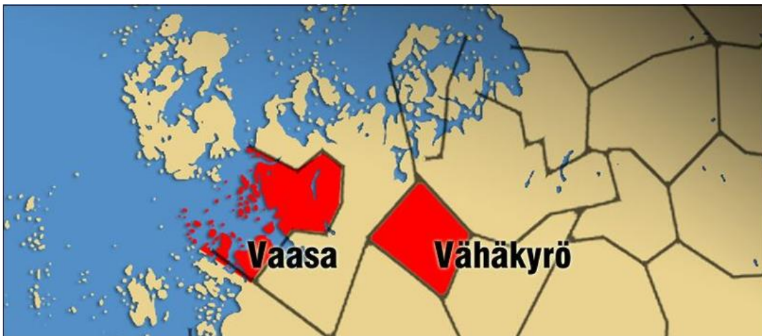
Kuva 3. Vaasa ja Vähäkyrö ennen kuntaliitosta (Yleisradio 2011: Kuntajakoselvitys kansissa ensi viikolla).

Vaasan ja Vähänkyrön kuntaliitos oli poikkeuksellinen siitä syystä, että kunnilla ei ollut yhteistä maarajaa, kuten voimme kuvasta 4 huomata. Se ei kuitenkaan muiden seikkojen osalta ollut poikkeuksellinen viime vuosien kuntaliitoksien joukossa. Liitos oli tyypillinen maakuntakeskukseen liittynyt pienempi kunta. Kosken ym. (2013: 22) mukaan on tyypillistä, että keskuskunnan asukasmäärä on jopa 90 prosenttia uuden kunnan asukasmäärästä. Saman suuruinen prosentiosuus oli myös tässä kuntaliitoksessa.