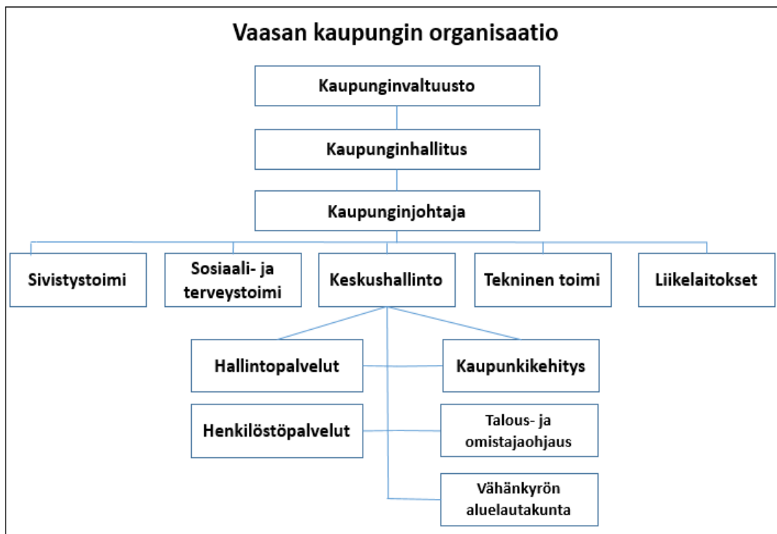
Kuva 4. Vaasan kaupungin organisaatio (Vaasan kaupungin organisaatio 2016).

Kuten kuva 4 osoittaa, Vähänkyrön aluelautakunta on Vaasan kaupungin organisaatiossa keskushallinnon alla. Aluelautakunta on selvästi sidottu kaupungin organisaatioon, toisin kuin Metsälän ja Leinamon. (2013: 21) mukaan suurin osa alueellisista toimielimistä.