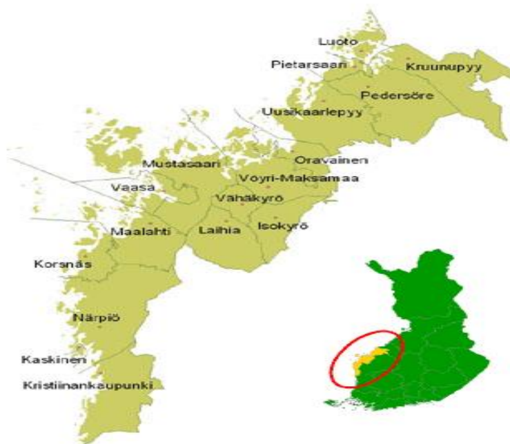
Kuvio 1. Pohjanmaan maakunta (Pohjanmaan liitto 2008).

Kyrönmaan seutukunta sijaitsee Pohjanmaan maakunnassa Länsi-Suomen läänissä (kuvio 1). Tähän seutukuntaan kuuluvat Isokyrö, Laihia ja Vähäkyrö. Pinta-alaltaan seutukunta on 1043 km 2 . Laihia on pinta-alaltaan (508 km 2 ) selvästi suurin ja Isokyrö on toiseksi suurin (357 km 2 ). Vähäkyrö on pienin (178 km 2 ) (Fennica 2008). Kyrönmaan kunnissa ei ole lentokenttää eikä sisämaa-asemansa johdosta satamia. Vaasassa sijaitsevaan lentokenttään ja satamaan on kuitenkin Kyrönmaan kunnista vain vajaa puolen tunnin ajomatka. Maantie- ja junayhteydet sen sijaan ovat kattavia. Kaikilla kunnilla on oma rautatieasemansa. Valtakunnallinen rataverkko kulkee Kyrönmaan läpi Vaasan ja Seinäjoen välissä. Kyrönmaan kuntien läpi kulkee valtatie 3, joka yhdistää lähellä sijaitsevat kaupungit Seinäjoen ja Vaasan. Tie on myös osa Sinisen tien matkailureittiä.