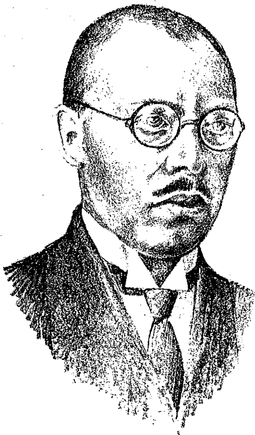
Makkai Sándor erdélyi püspöksége idején — Berkesi Sándorné rajza egy 1932-ben készült fénykép alapján —