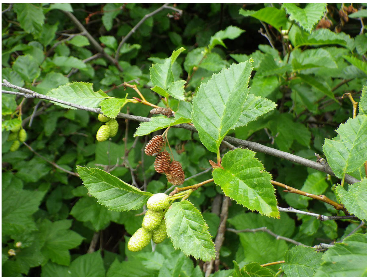
Slika 1. Zelena joha - Alnus alnobetula subsp. alnobetula .

Alnus alnobetula - prirodno je rasprostranjena u sjevernoj i srednjoj Europi te u sjevernoj Aziji i Sjevernoj Americi. Zelena joha raste na kiselim i vlažnim tlima u planinskom području na nadmorskoj visini do 2100 metara. Pojavljuje se u mješovitim šumama i karakterizira ju dobro razvijen korijenski sustav koji sprječava eroziju tla (Vukićević 1987).