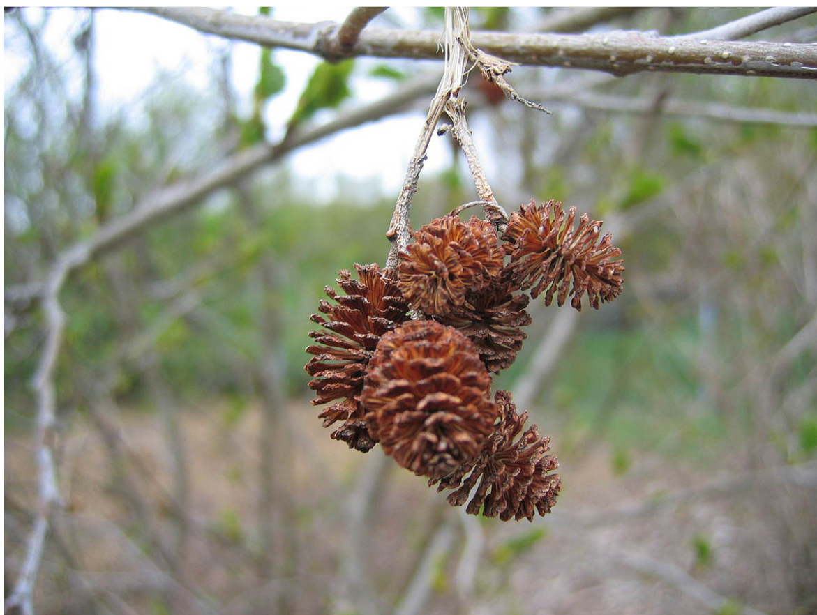
Slika 2. Češerići u kojima se nalaze plodovi ( Alnus alnobetula subsp. alnobetula ).

Plodovi su sitni, spljoštani, jednosjemeni oraščići koji se nalaze u smeđim češerićima koji su sastavljeni od drvenih ljustaka. Oraščić je svjetlosmeđe boje, tri mm velik, plosnat, a na vrhu ima ostatak dviju njuški tučka. Postrano ima 2 uskra krilca koji su prozirnog ruba. Plodovi su anemohorni i hidrohorni, dozrijevaju u listopadu i studenom (Idžojtić 2009).