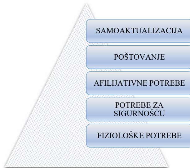
Slika 1. Maslowljeva hijerarhija potreba

Polazište u izradi koncepta sestrinske skrbi za starije osobe ima Maslowljeva teorija motivacije. Prema teoriji motivacije A.G.Maslowa životne potrebe svrstavaju se u pet kategorija; fiziološke potrebe, potrebe za sigurnošću, afilijativne potrebe, potrebe za poštovanjem te potrebe za samoaktualizacijom. (Maslow 1970.) (slika 1.)