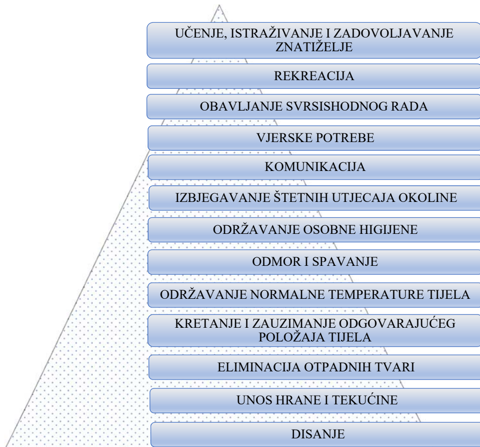
Slika 2. Osnovne ljudske potrebe prema V.Henderson

V. Henderson je definirala osnovne ljudske potrebe te ih svela u 14 kategorija; disanje, unos hrane i tekućine, eliminacija otpadnih tvari, kretanje i zauzimanje odgovarajućeg položaja tijela, spavanje i odmor, održavanje normalne temperature tijela, održavanje osobne higijene, izbjegavanje štetnih utjecaja okoline, komunikacija, vjerske potrebe, obavljanje svrsishodnog rada te rekreacija učenje, istraživanje i zadovoljavanje znatiželje (slika 2.)