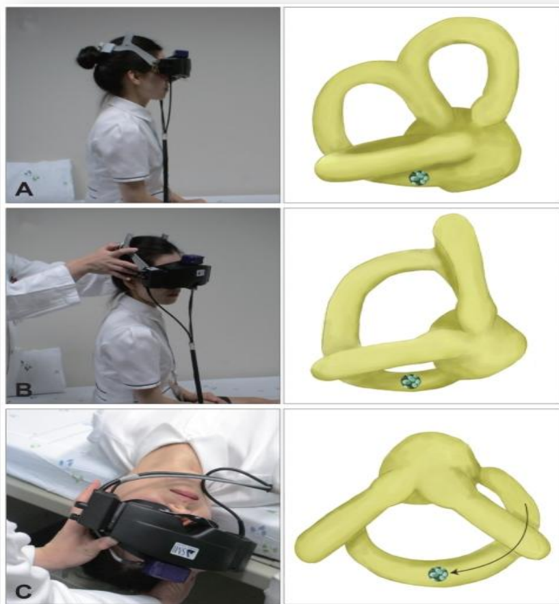
Slika 1. Dix-Hallpiekov test. (33)

Ukoliko je uzrok vrtoglavice teško dijagnosticirati, te osoba nema karakterističan nistagmus, a ima druge neurološke ispade (dvoslike, poremećaj govora, motorički ispadi itd.) ili pak vrtoglavicu koja ne odgovara na terapiju, liječnik treba naručiti bolesnika na dodatne pretrage, kao što su: magnetska rezonancija, elektronistagmografija, videonistagmografija i audiometrija.