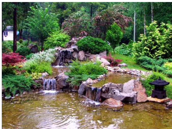
Slika 2. Primjer umjetne vodene površine.

Prvo i osnovno pravilo kod postavljanja umjetnih vodenih površina je pravilan odabir mjesta izrade, a to su u pravilu prirodne depresije. (Nevečerel, 2014.)