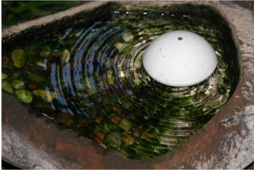
Slika 5. Primjer pojilišta za ptice.