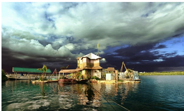
Slika 6. Spiralni otok Richarda Sowe.

Otok predstavlja jedinstveni eko projekt jer je u potpunosti izgrađen od materijala koji se mogu reciklirati, ali i pravi turističku atrakciju jer je otvoren za posjetitelje.