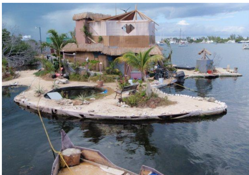
Slika 7. Kuća i jezero na otoku.