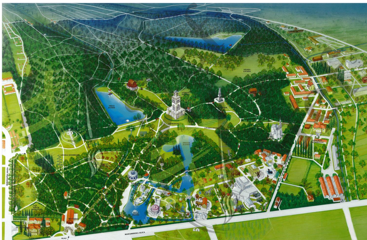
Slika 3. Položaj jezera u Parku Maksimir.

U parku Maksimiru je tijekom vremena formirano šest jezera od kojih danas postoje pet - prvo, drugo, treće, četvrto i peto. Godine 1839. izgrađeno je prvo jezero uz Maksimirsku ulicu, dvije godine kasnije drugo, zatim treće koje je danas isušeno četvrto jezero. Umjetno oblikovana jezera snabdijevaju se vodom iz potoka Bliznec koji direktno utječe u drugo i peto jezero.