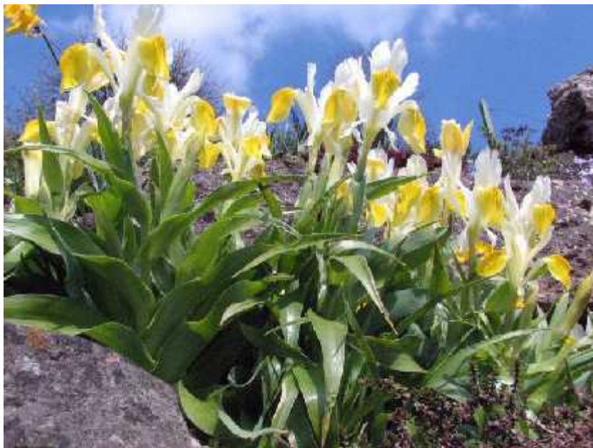
Slika 11. Iris bucharica Foster

Iris bucharica Foster ( sl. 11 ) naj eš e je kultivirani pripadnik podroda. Cvjeta bijelo-žutim cvjetovima, a listovi su široki i kao kod ve ine Juno irisa raspore eni tako da podsjeaju na mali kompaktni kukuruz. Potje e iz sjeveroisto nog Afganistana, Tadžikistana i Uzbekistana gdje raste na kamenitim i travnatim obroncima na velikim visinama. ((Köhlein 1981., http://www.pacificbulbsociety.org/pbswiki/index.php/JunoIris )