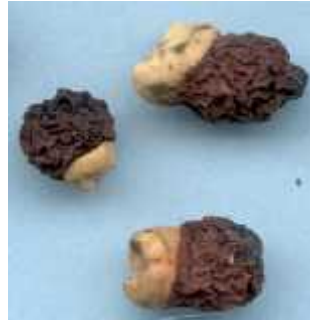
Slika 6. Sjemenke irisa koje nose arilus ( http://www.badbear.com/newasi/index.pl?Arils )

Sekcije Psammiris , Oncocyclus , Pseudoregalia i Regalia imaju arilus na sjemenci, pa se ponekad za njih koristi naziv arilni irisi. Arilus (sl. 6) je bijela mesnata struktura na sjemenci koja privlači mrave koji zatim sjemenku odvlače u svoje nastambe, te na taj način pomažu u raznošenju i klijanju sjemena. Predstavnici ove tri sekcije su najcijenjeniji irisi u hortikulturi jer su često tamno obojeni, prošarani tamnim točkama ili pak nose crnu bradu.