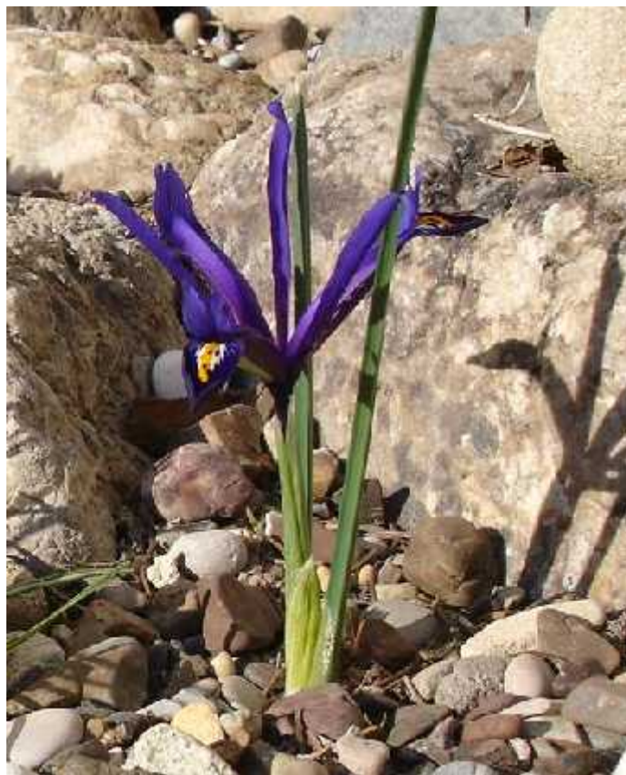
Slika 12. Iris reticulata Bieb.

Iris reticulata Bieb. (sl. 12) najbolje je poznata vrsta iz ovoga malog podroda. Krajem zime cvjeta cvjetovima koji mogu biti obojeni plavo ili ljubi asto. Postoje mnogi prirodni, ali i umjetni varijeteti. Biljke sa cvijetom su visoke od 7 do 14 cm, a staništa su im od Turske, Irana, Iraka, bivšeg SSSR-a, gorje Kavkaz i Transkavkaška regija. (Köhlein 1981., http://www.pacificbulbsociety.org/pbswiki/index.php/ReticulataIris )