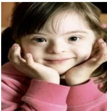
Slika 3. Karakterističan izgled osobe s Down sindromom