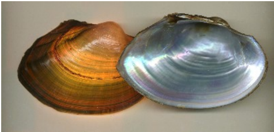
Slika 3. – Vrsta Anodonta woodiana

Viljevački ribnjak je zapravo kanal koji je proširen i produbljen prije 15 godina. Dug je više od pola kilometra, širok 6-12 m, dubina se kreće od 1 do 4 m. Za višeg je vodostaja ribnjak spojen s Dravom kanalom dugim 1 km pa razina vode u njemu ovisi o razini vode u Dravi. Zbog debelog sloja mulja na dnu voda je u njemu uvijek mutna. Budući da se ribnjak koristi za sportski ribolov, redovno se poribljava, što ostavlja mogućnost unosa, za ovo područje alohtonih vrsta. Ovo je ljeto unesena jedna vrsta vodene paprati koja se vrlo brzo proširila preko cijele površine ribnjaka, stvarajući na njoj debeli sloj zbog kojeg je došlo i do pomora ribe. Od mekušaca je s ribom vjerojatno unesena vrsta istočnoazijska bezupka, Anodonta woodiana (Slika 3) koja je ovdje postala vrlo brojna te najvjerojatnije potpuno istisnula lokalne vrste, budući da ih već neko vrijeme ne nalazim u ribnjaku.