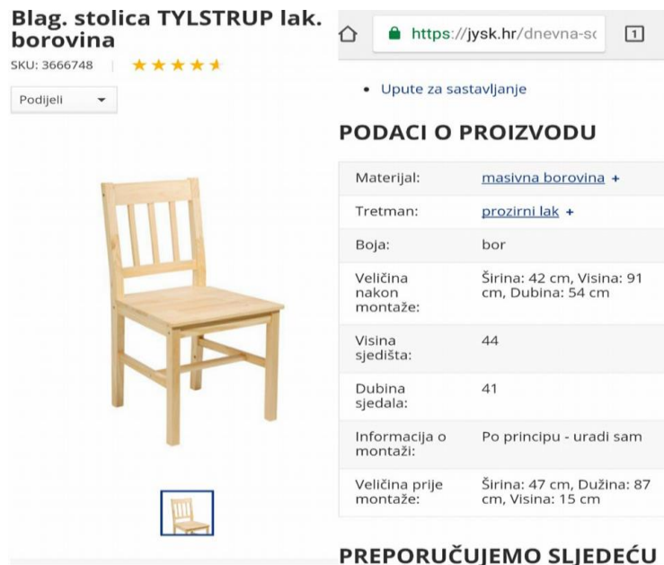
Slika 9. Osnovni opis proizvoda, stolice

Većina trgovina na web stranice stavljaju samo osnovni opis (slika 9) proizvoda (dimenzije, boju, upute o sastavljanju), deklaraciju proizvoda izostavljaju koja je kupcu potrebna u konačnom odlučivanju pri on-line kupnji proizvoda.