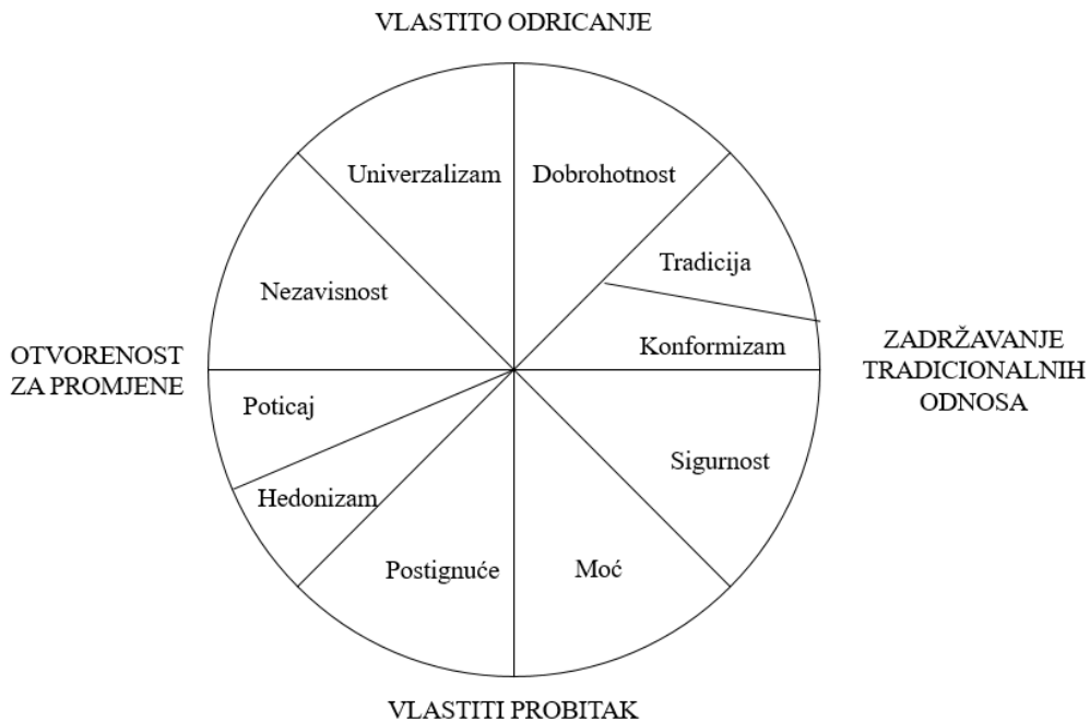
Slika 1. Prikaz teorijskih međuodnosa osobnih vrijednosti (Schwartz, 2012)

a univerzalizam i nezavisnost na oslanjanje na vlastitu prosudbu, uz uvažavanje raznolikosti postojanja.