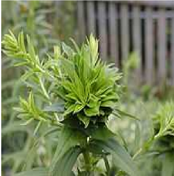
Slika 2. Filodija-abnormalno stvaranje listova