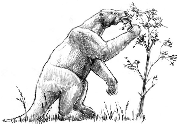
Slika 3. Nothrotheriops shastensis (preuzeto s http3 ).