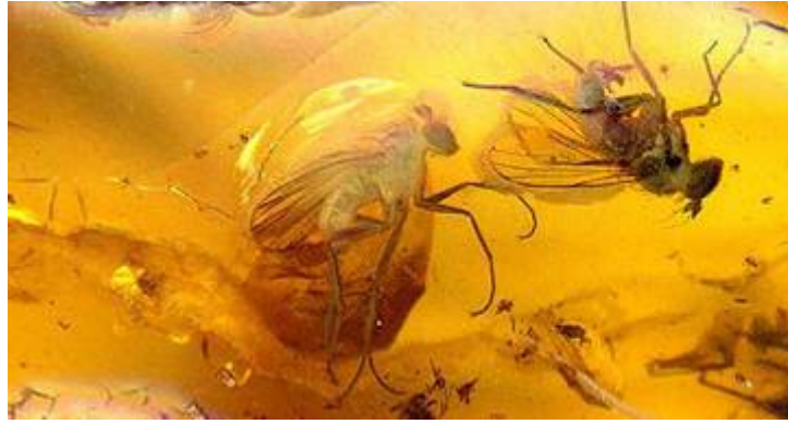
Slika 1. Prikaz dijela jantara u kojem su očuvani primjerci insekata.

Pošto u toj smoli najčešće nalazimo očuvane insekte (Sl. 1.), brojna istraživanja bila su usmjerena ka istraživanju termita (Desalle et al., 1992) i pčela (Cano et al., 1992a; 1992b; 1993). Općenito, insekti su nezanemarivi kada su u pitanju studije drevne DNA jer su važni u istraživanju ekosistema, klime i biodiverziteta koji su nekoć vladali na Zemlji. No, tadašnja istraživanja nisu bila usmjerena samo na fosile iz jantara, već i na fosile očuvane u sedimentu. Prva takva istraživanja provedena su na biljkama koje su datirale iz miocena (Golenberg et al., 1990; Golenberg, 1991; Poinar et al., 1993). Kako se sve više radova objavljivalo, istraživači različitih područja prirodnih znanosti ujedinjavali su se u istraživanjima te je započela era intenzivnijeg proučavanja evolucije na temelju izumrlih ostataka biljaka i životinja.