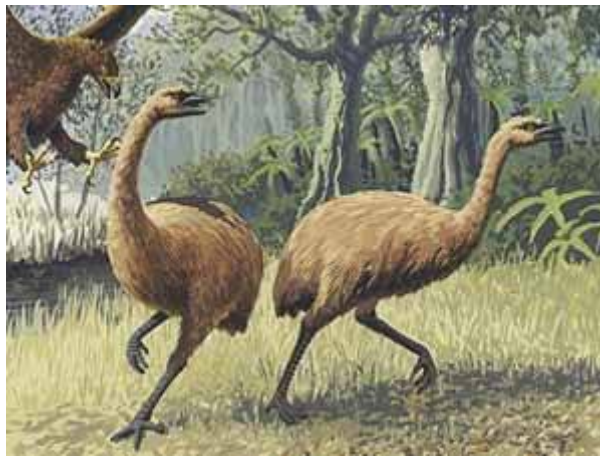
Slika 2. Najvjerojatniji izgled ptice moa.

u Australiji. Analiza je pokazala sličnost s australijskim emuom što je iniciralo na činjenicu da je Novi Zeland koloniziran dva puta pticama koje ne mogu letjeti. Prvi put s precima ptice moa, a drugi put pretkom ptice kiwi. Interesantna su i istraživanja sisavaca iz kasnog pleistocena koja su uslijedila. Istraživana je DNA sekvenca mamuta (Hagelberg et al., 1994; Bailey et al., 1996). Sekvencirana je i DNA pleistocenskog velikog ljenjivca (Höss et al., 1996), špiljskog lava (Burger et al., 2004) i smeđeg medvjeda (Hänni et al., 1994; Barnes et al., 2002; Hofreiter et al., 2002) što je značajno pridonijelo rasvjetljavanju genetičkih odnosa tih izumrlih životinja.