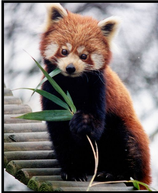
Slika 6. Crveni panda ( Ailurus fulgens )

U Zg ZOO nalazi se 1 mužjak i 1 ženka, dok u zatočeništvu u svijetu nalazimo 219 mužjaka, 231 ženku, te 26 mladunaca (rođenih u proteklih 12 mjeseci). Preuzeto i prilagođeno iz http://www.isis.org/CMSHOME/ .