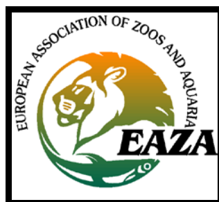
Slika 5. EAZA

Sam zoološki vrt član je nekoliko svjetskih i europskih organizacija, no za moj seminarski rad posebice ja važno članstvo u EAZA-i (European Association of Zoos and Aquaria). To je europska organizacija koja okuplja zoološke vrtove i akvarije sa oko 350 članova koje se nalaze u 35 zemalja Europe. Sama EAZA pokrenula je Europski program za uzgoj ugroženih vrsta životinja - EEP (European Endangered Species Programmes), koji Zoološki vrt grada Zagreba podupire sa 15 različitih vrsta. Među tih 15 vrsta, nalaze se i 5 vrsta zvijeri o kojima ću ja pisati. Pa, krenimo redom. Preuzeto iz http://www.zgzoo.com/hr/edukacija/kampanje/eaza-godina-europskih-zvijeri/