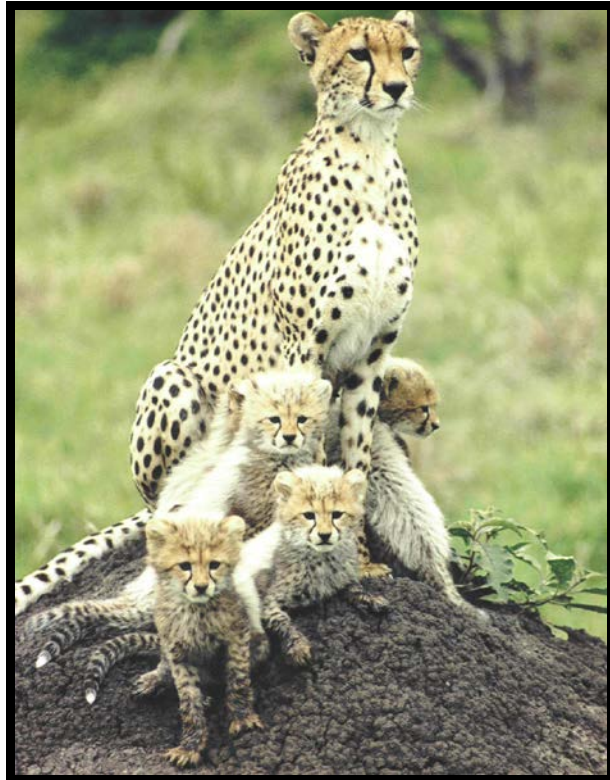
Slika 6. Afrički gepard ( Acinonyx jubatus jubatus )

U zagrebačkom zoološkom vrtu nalazi se 1 gepard, dok se u ostalim svjetskim zoološkim vrtovima i raznim drugim sličnim ustanovama, koji se nalaze u Međunarodnom informacijskom sustavu o životinjama u zatočeništvu – ISIS (International Species Information System) nalazi ukupno 1117 mužjaka, 812 ženki i 63 mladunaca (rođenih u proteklih 12 mjeseci). Preuzeto i prilagođeno iz http://www.isis.org/CMSHOME/ .