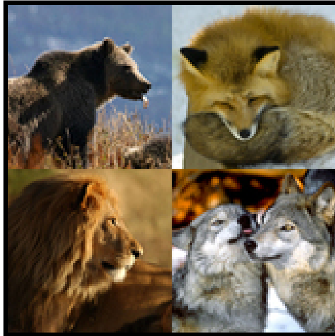
Slika 3. Podred prave zvijeri ( Fissipedia )

Podred pravih zvijeri ( Fissipedia ) su kopnene zvijeri, koje su brojnije od perajara, te njima pripada većina vrsta zvijeri. Krzno im može biti pjegavo, prugasto ili jednobožno, te imaju znojne žlijezde. Mladi se rađaju slijepi i dulje su vrijeme nemoćni, nakon čega se brzo razvijaju. Ovaj podred sastoji se od 7 porodica, a to su: medvjedi ( Ursidae ), rakuni i pande ( Procyonidae ), psi ( Canidae ), kune ( Mustelidae ), hijene ( Hyaenidae ), prave cibetke ( Viverridae ), te mačke ( Felidae ).