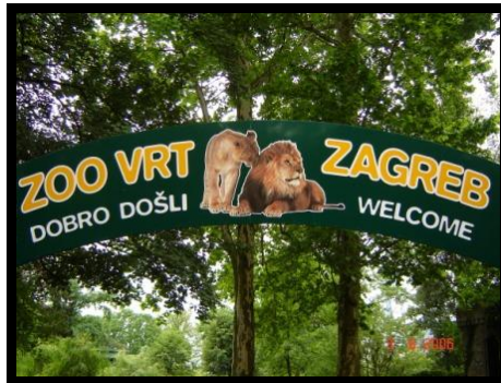
Slika 4. Zoološki vrt grada Zagreba

Zoološki vrt grada Zagreba osnovan je 1925.g. na prvom jezeru u parku Maksimir. Na sam dan otvorenja, 27. lipnja 1925.g. u zoološkom vrtu nalazile su se samo tri lisice i tri sove. Uz pomoć građana grada Zagreba i drugih zooloških vrtova, naš zoološki vrt se polagano širio kako u broju vrsta tako i u površini. Danas vrt broji oko 275 vrsta, 2225 jedinki o kojima brine 65 zaposlenika. Tijekom cijele povijesti zoološki vrt se obnavljao, da bi 1999.g. počeli sa velikim obnavljanjem koje traje i dan danas. Preuzeto i prilagođeno iz http://www.zgzoo.com/hr/o-nama/ .