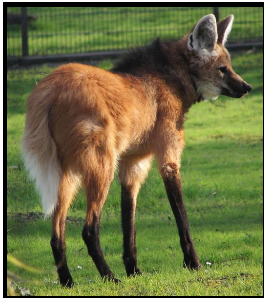
Slika 6. Grivasti vuk ( Chrysocyon brachyurus )

U Zg ZOO se nalaze 2 ženke, dok svijet u zatočeništvu broji 107 mužjaka, 126 ženki, te 19 mladunaca (rođenih u proteklih 12 mjeseci). Preuzeto i prilagođeno iz http://www.isis.org/CMSHOME/ .