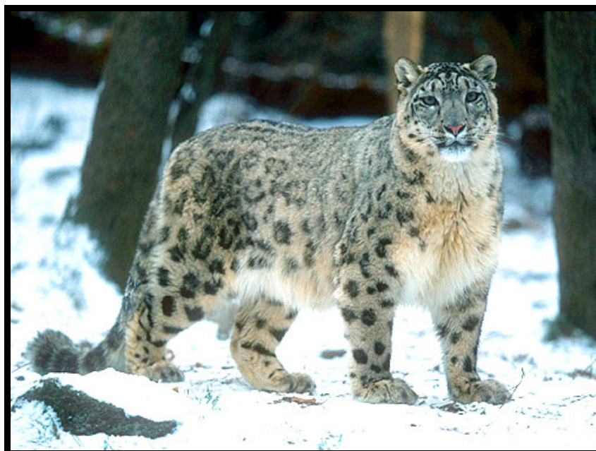
Slika 7. Snježni leopard ( Uncia uncia )

U Zg ZOO nalazi se 1 mužjak i 1 ženka, dok u zatočeništvu u svijetu nalazimo 219 mužjaka, 231 ženku, te 26 mladunaca (rođenih u proteklih 12 mjeseci). Preuzeto i prilagođeno iz http://www.isis.org/CMSHOME/ .