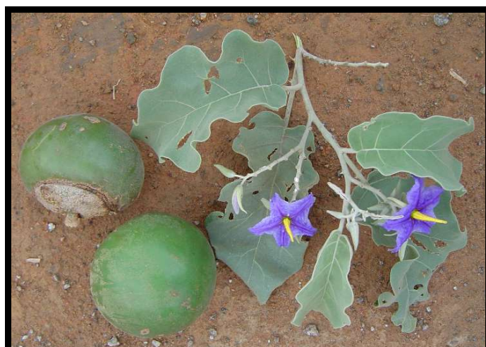
Slika 7. Vučja jabuka ( Solanum lycocarpum ) ( http://www.arvores.brasil.nom.br/new/lobeira/Solanum%20lycocarpum03.jpg )