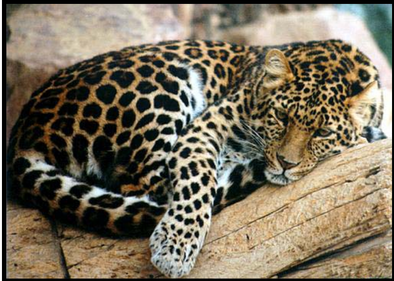
Slika 8. Kineski leopard ( Panthera pardus japonensis )