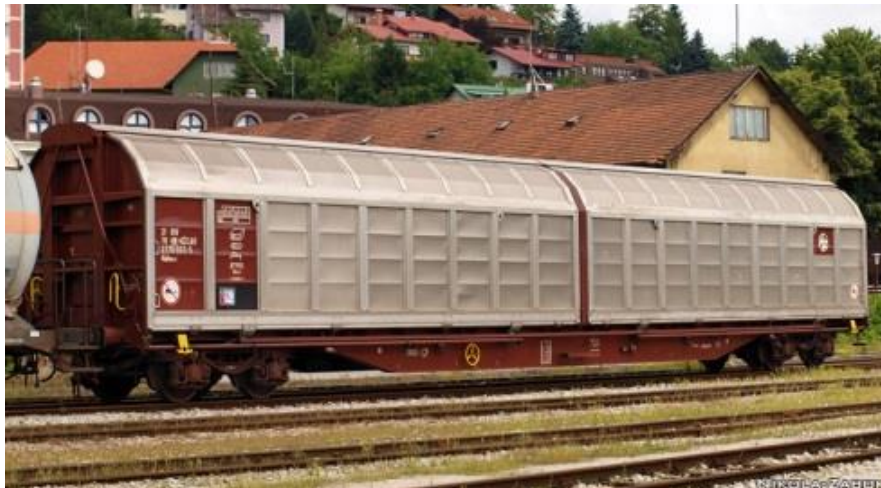
Slika 2.: Vagon serije H, podserija Habbins

Vagoni serije H su specijalni zatvoreni vagoni jer imaju mogućnost otvaranja vrata preko dvije trećine svake bočne stranice njihovim uzdužnim pomicanjem što uvelike olakšava ukrcaj i iskrcaj roba pomoću viličara po cijelom korisnom prostoru vagona, roba koja zahtjeva provjetranje ne može se prevoziti ovim vagonima jer nemaju prostor za provjetranje.