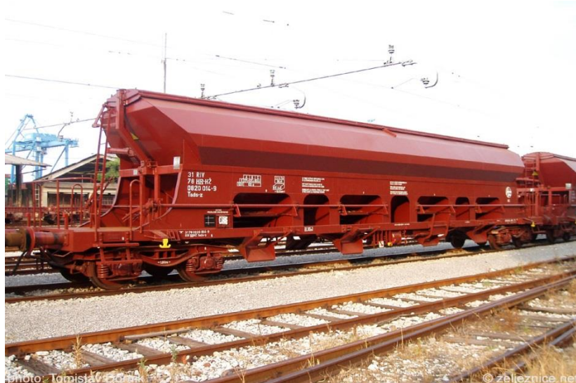
Slika 4.: Vagon serije T, podserije Tads