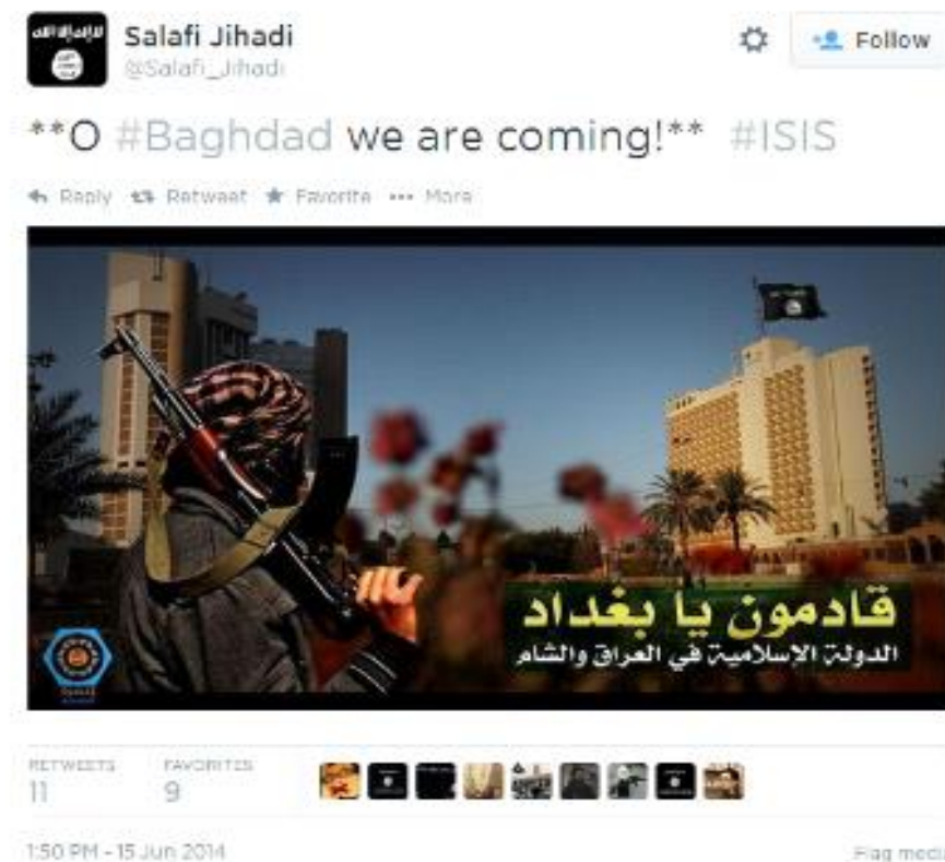
Slika 1. Hashtag kampanja za vrijeme napada Islamske države na grad Mosul

na arapskom podrazumijeva „one marljive“. Uz pomoć njih radikalni islamisti uspješno su provodili svoju strategiju na društvenim mrežama. U kratkom roku uspjeli su objaviti velik broj hashtagova (#) koji su ubrzo postali trend, a priča se potom pretvorila u kampanju. Upravo je uz pomoć tih kampanji Islamska država uspijevala zastrašiti vanjske promatrače, ali i privući potencijalne borce (Berger, Morgan, 2015: 29). Tako je u lipnju 2014., za vrijeme napada na irački grad Mosul, uz pomoć aplikacije Dawn objavljeno gotovo 40 tisuća tweetova . Također, velik broj korisnika aplikacije počeo je objavljivati slike naoružanih džihadista koji gledaju prema zastavi Islamske države, a u kojima je pisalo “ We are coming Baghdad ”. Svatko tko je u tom trenutku u tražilicu upisao „Baghdad“ pojavila se slika kampanje (Slika 1) 4 (Berger, 2014).