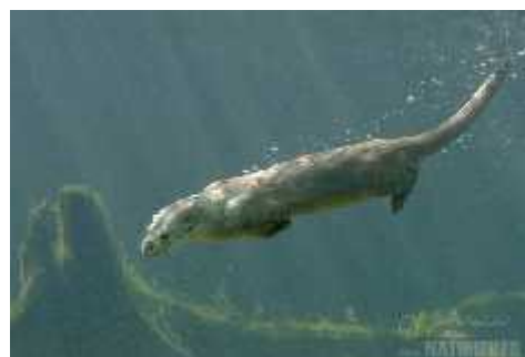
Slika 4. Kretanje vidre na kopnu, foto: J. Bohdal Slika 5. Vidra roni pod vodom, foto: J. Bohdal ( http://www.naturephoto-cz.com/otter-photo-884.html )

Od osjetila, vidra ima dobro razvijen osjet vida, sluha i njuha. U uvjetima slabe svjetlosti pod vodom oslanja se na osjet dodira pomoću brkova ( vibrissae ). Komunikacija između vidri odvija se pomoću mirisa, a rijetko glasanjem prodornim zviždukom, kratkim cvrčanjem te režanjem i pištanjem. Izmetom karakterističnog mirisa vidre označavaju svoj teritorij ostavljajući ga na istaknutim mjestima kao što su velike stijene, debla na obali, ušća pritoka i kanala u glavnu rijeku ili ispod mostova. Osim izmeta mogu se pronaći i želatinozne izlučevine. Velicina teritorija varira ovisno o fizikalnim značajkama vode i dostupnosti hrane. Srednja vrijednost gustoće vidri je jedna jedinka po 15 km toka. U zatočeništvu vidre mogu živjeti od 11 do 16 godina, dok u divljini žive puno kraće, uglavnom od 3 do 4 godine (Jelić, 2010.).