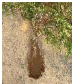
Slika 12. Izmet na vrhu humka, foto: M. Jelić Slika 13. Želatinozna izlučevina, foto: M. Jelić

( http://www.dzpz.hr/dokumenti_upload/20110401/dzpz201104011327570.pdf )