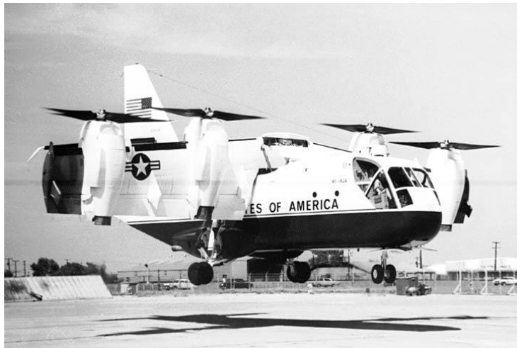
Slika 4. XC-142A

XC-142A (slika 4) prototip letjelice koji je prvi korišten za potrebe izučavanja vertikalnog polijetanja i slijetanja upotrebom krila koja mijenjaju nagib (engl. tilt-wing) iz vertikalnog u horizontalni položaj i obratno.