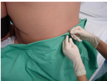
Slika 1. Epiduralna anestezija postupka

Skrotum se očisti antiseptičkim sredstvom, te se zatim temeljito ispiru fiziološkom otopinom kako bi se uklonio rezidualni antiseptik. Pod lokalnom anestezijom palpira se glava pasjemenika i stabilizira se između palca i kažiprsta. Zatim se izvodi punkcija (direktno kroz kožu skrotuma) pomoću 26-G iglom pričvršćenom za tuberkulinsku špricu. U njoj se nalazi 0,1 ml medija za ispiranje sjemena. Iglu treba polagano i nježno uvoditi u kanal epididimisa. U isto vrijeme asistent povlači dršku šprice i lagano stvara usisnu silu. Ponekad se mogu opaziti kapljice tekućine kako ulaze u špricu, ali je u nekim slučajevima aspirat iz epididimisa tako oskudan da se uopće ne vidi golim okom. Sadržaj šprice se nježno izbacuje u zdjelicu i pregledava se za nalaz spermija. Ako pokretni spermiji nisu pronađeni, zahvat se ponavlja na drugom mjestu glave epididimisa. Kod opstruktivne azoospermije kvalitetniji spermiji se dobivaju iz proksimalnog dijela pasjemenika, dok u distalnijim dijelovima kvaliteta pada. Budući da je ova procedura „na slijepo“, ponekad treba izvršiti više zahvata dok se ne dobiju spermiji odgovarajuće kvalitete.