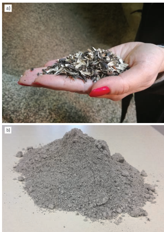
Slika 3. a) Suncokretove ljuske; b) Biopepeo od spaljivanja suncokretovih ljusaka

Udio biomase kao obnovljivog izvora u proizvodnji ukupne energije sve je veći. Spaljivanjem biomase u termoelektranama nastaju velike količine pepela koji treba ponovno upotrijebiti. Nastali pepeo najčešće se odlaže na odlagalištima otpada, a s obzirom na trend povećanja udjela obnovljivih izvora u cjelokupnoj proizvodnji energije, količine nastalog pepela sve se više gomilaju. Povoljna fizikalna i kemijska svojstva biopepela, kao i pozitivna iskustva primjene pepela od izgranja ugljena, potaknula su i sve brojnija istraživanja primjene biopepela u građevinarstvu. Provedena su istraživanja pokazala da biopepeli znatno variraju u svom sastavu i svojstvima ovisno o porijeklu biomase, rukovanju biomasom, načinu i temperaturi spaljivanja. Velik raspon svojstava znači i brojne mogućnosti primjene biopepela u cestogradnji kao zamjene tradicionalnim materijalima. Kemijski sastav biopepela, osobito udio \text{CaO} i pucolana, upućuje na mogućnost djelomične ili potpune zamjene