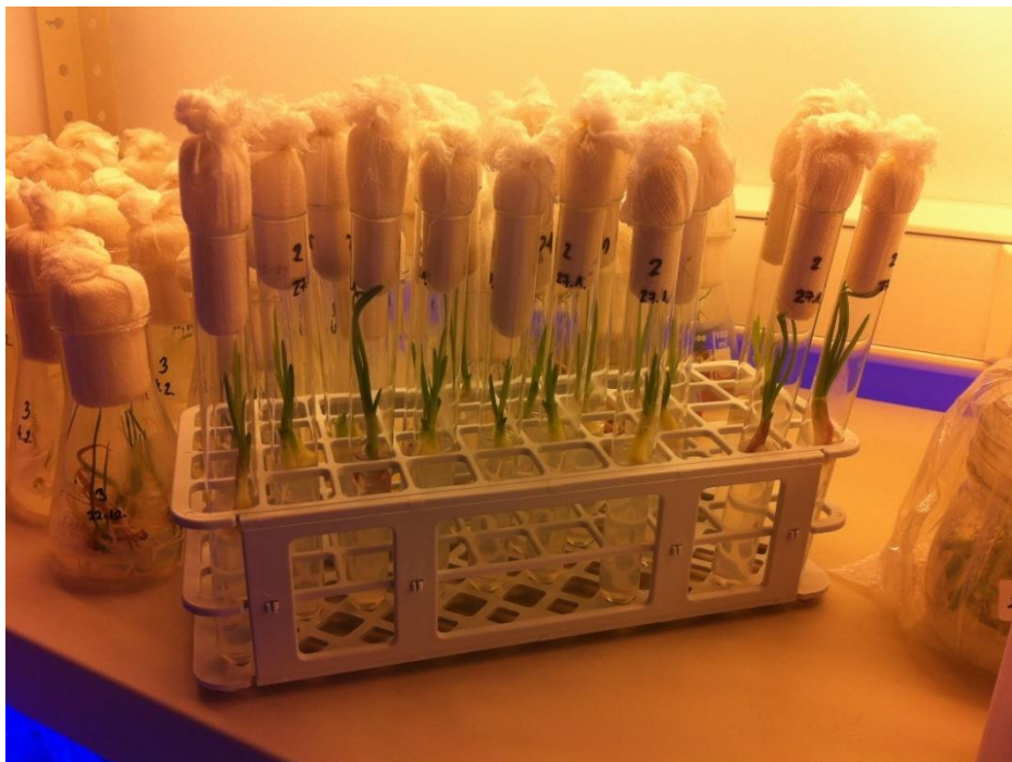
Slika 7. Eksplantati ljutike pod bijelim svjetlom

Rukovanje s eksplantatima prilikom uvođenja u kulturu provedeno je korištenjem sterilnog laboratorijskog pribora te se odvijalo u sterilnim uvjetima. Uvuđenje u kulturu se odvija na način da se pincetom svaki eksplantat uroni u hranjivu otopinu koja se nalazi u epruveti, bitno je plemenikom dezinficirati pincetu prilikom svakog novog eksplantata kako bi se smanjio postotak kontaminacije te se iz istog razloga na epruvetu stavlja i čep. (Slika 6, slika 7.).