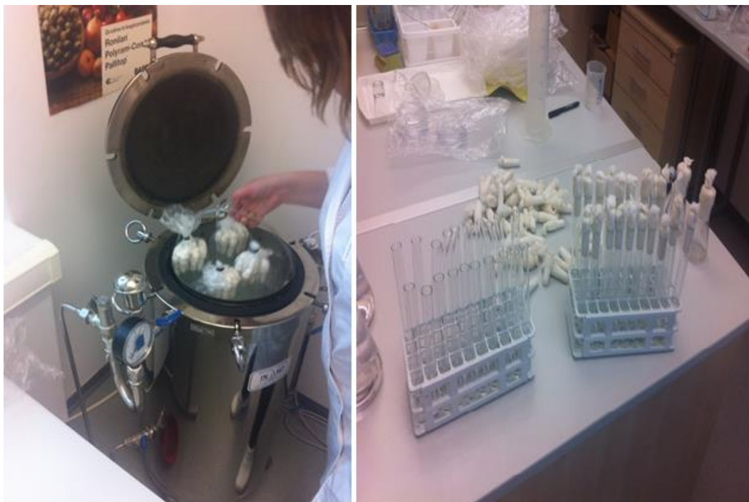
Slika 3. Punjenje i sterilizacija epruveta s hranjivom podlogom