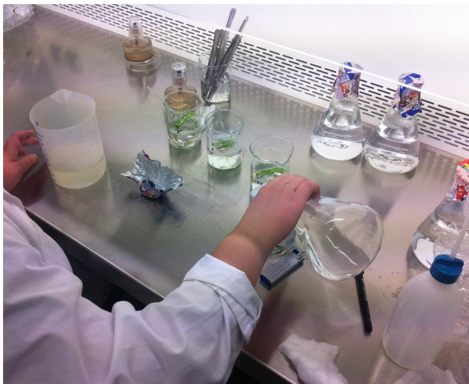
Slika 6. Uvođenje eksplantata ljutike u kulturu

Pribor koji se koristio za fizičko izdvajanje eksplantata prethodno je prokuhan i očišćen sa 96% etanolom. Izdvajanje je obavljeno u laminaru u sterilnim uvjetima. Kao eksplantati korišteni su dijelovi klice lukovica ljutike. Izdvajanje klica je obavljeno pomoću laboratorijskog nožića i pincete u Petrijevim zdjelicama. Laboratorijski nožić i pinceta su za vrijeme izdvajanja sterilizirani ispiranjem u alkoholu i paljenjem na plameniku. Izdvojene klice su sterilizirane 10 minuta u varikini koju je dodano nekoliko kapi deterdženta (Slika. 5)