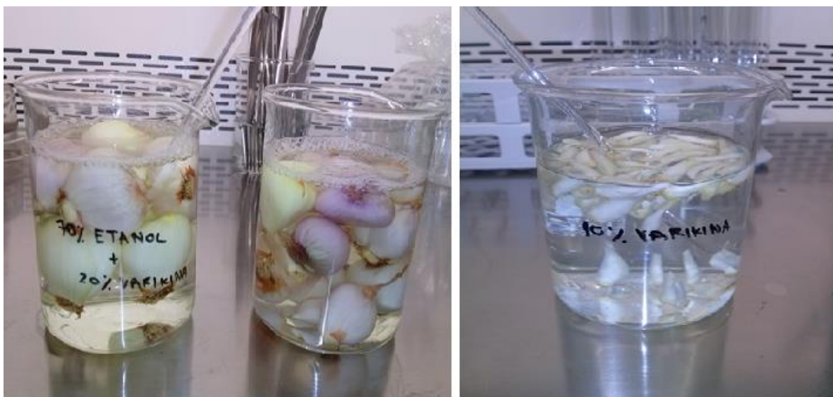
Slika 5. Dezinfekcija lukovica, izdvajanje i definfekcija eksplantata ljutike