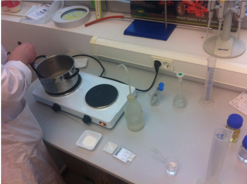
Slika 2. Priprema hranjive podloge