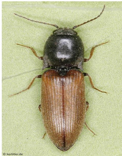
Slika 7. Imago klisnjaka vrste A.ustulatus Schaller