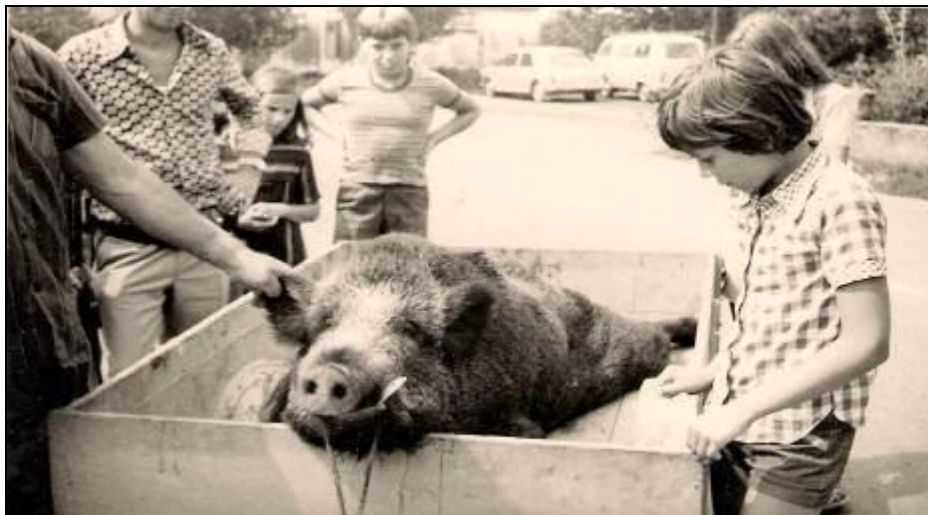
Slika 1: Prva divlja svinja odstreljena na otoku Krku 1974. g.