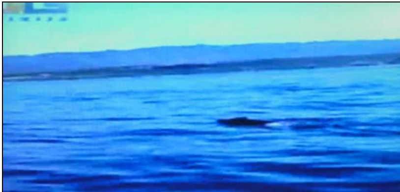
Slika 3: Divlja svinja pliva u moru s otoka Cresa na Krk (Foto: RTL TV)