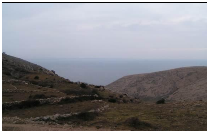
Slika 18: Pogled na jugozapadni dio otoka Krka- lovište VIII/17 Punat