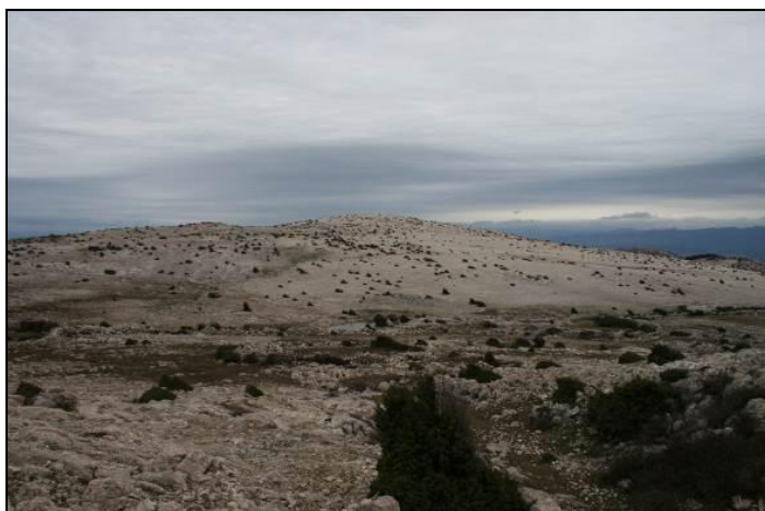
Slika 16: Najviši vrh otoka Krka Obzova (568m.n.m.)-VIII/17 Punat