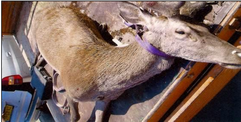
Slika 2: Izvađeni utopljeni jelen na plaži Baška 2008. g.