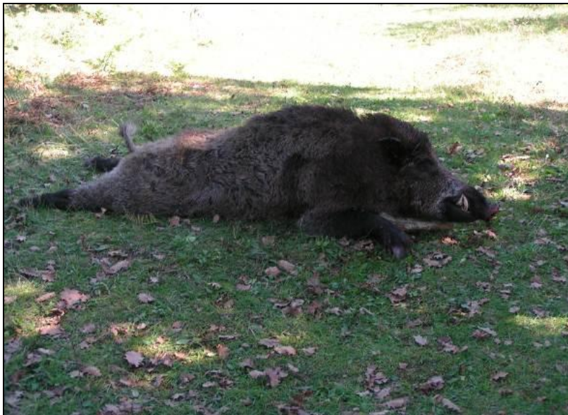
Slika 19: Vepar sa zlatnim trofejom; odstreljen u lovištu VIII/101 Krk 18. studenog 2007., lovac Mauro Mičetić, ocijenjen sa 124,15 točaka

Veoma je atraktivna lovna divljač. Zauzima veliki postotak odstreljene krupne divljači u Republici Hrvatskoj. U pravilu lov se dijeli na pojedinačni i skupni lov. Pojedinačni lov je najčešći način lova. Vršiti se na način dočekivanja divljači s lovačkih čeka ili zasjeda koji se nalaze najčešće u blizini poljoprivrednih kultura pred zriobom. Pojedinačnim načinom lova često se lovi šuljanjem, pretraživanjem uz pomoć psa ili slučajnim susretom. Skupni lov je specifičan i zanimljiv zbog više razloga. Divlja svinja je jedina vrsta krupne divljači u Hrvatskoj koja se smije loviti u skupnom lovu uz upotrebu pasa i upotrebom oružja sa glatkim cijevima. Najčešći je za vrijeme zimskih mjeseci i spada u jedan od najatraktivnijih lovova pružajući potpuni lovni užitek (GRUBEŠIĆ, 2004.) .