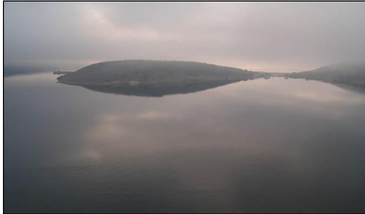
Slika 7: Pogled na sj. istočni dio otoka Krka - lovište VIII/101 Krk