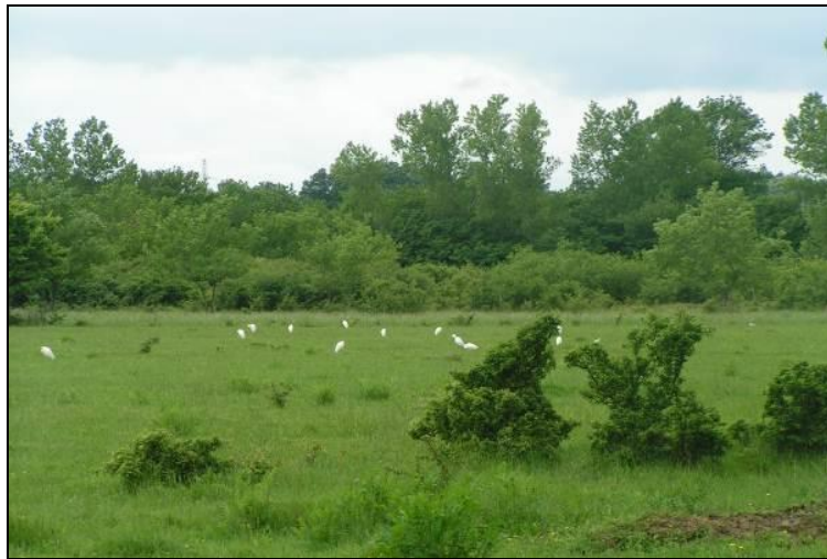
Slika 8: Pogled na centralni dio otoka Krka, «Omišljanski lug» - lovište VIII/101 Krk