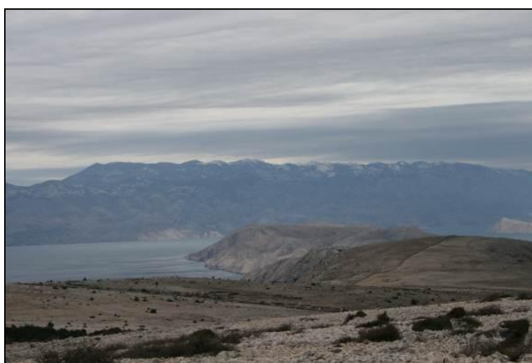
Slika 15: Pogled na otok Krk jugoistočni dio - lovište VIII/1 Baška