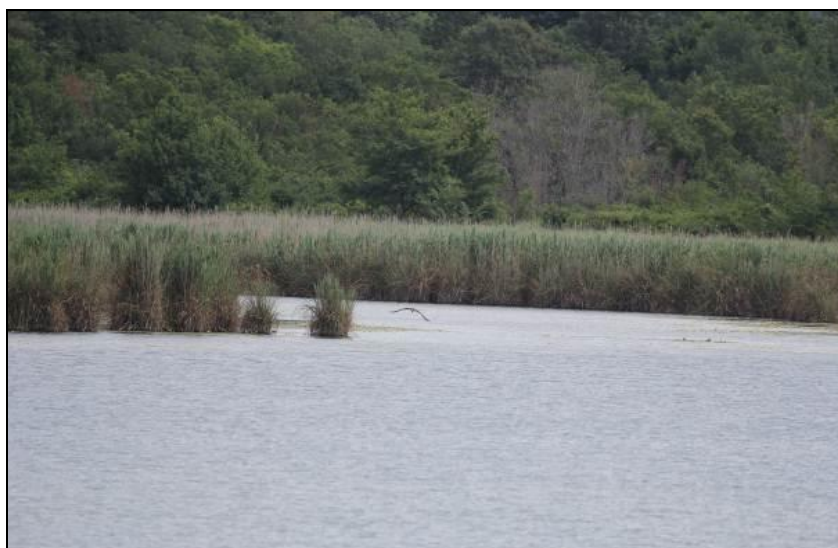
Slika 12: Jezero kraj Njivica - lovište VIII/101 Krk