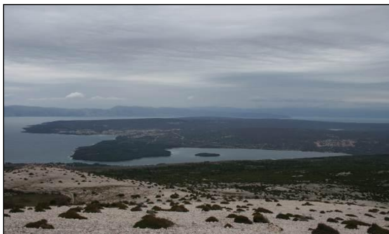
Slika 13: Pogled na južni dio otoka Krka na lovište VIII/101 Krk iz lovišta VIII/17 Punat