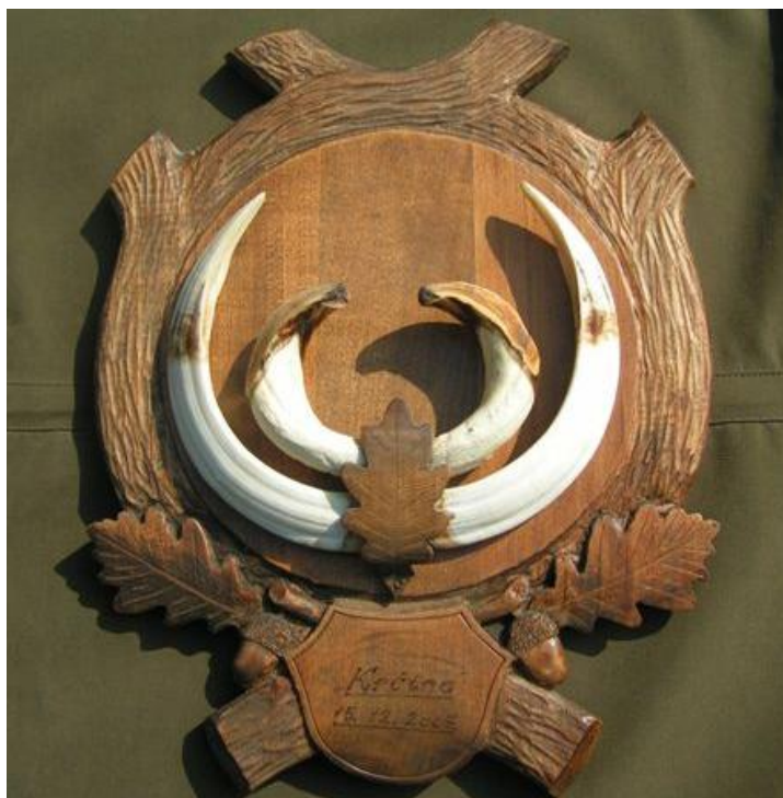
Slika 20: Najjače kljove veprova s otoka Krka; odstreljen u lovištu VIII/101 Krk 15. prosinca 2007. lovac Miljenko Drpić, ocijenjen sa 137,55 točaka

Kod divlje svinje trofej predstavljaju zubi očnjaci kod muških grla starijih od dvije godine. Ovaj trofej nazivamo kljovama, a djelimo ih na brusače i sjekače. Brusači su zubi očnjaci iz gornje vilice, a sjekači su zubi očnjaci iz donje vilice (VRATARIĆ, 2004.). U daljnjoj analizi trofeje nećemo djeliti po lovištima nego ćemo ih promatrati i uspoređivati kao trofeje stečene na otoku Krku.