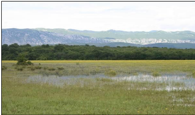
Slika 11: Poplavljena livada u proljeće »Dobrinjski lug« -lovište VIII/101 Krk