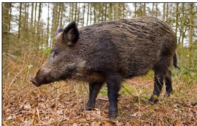
Slika 5: Divlja svinja