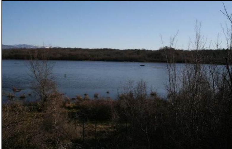
Slika 10: Poplavljena livada u zimi »Dobrinjski lug« - lovište VIII/101 Krk