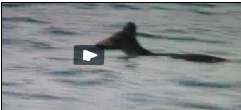
Slika 4: Srna u moru pliva s kopna na otok Krk