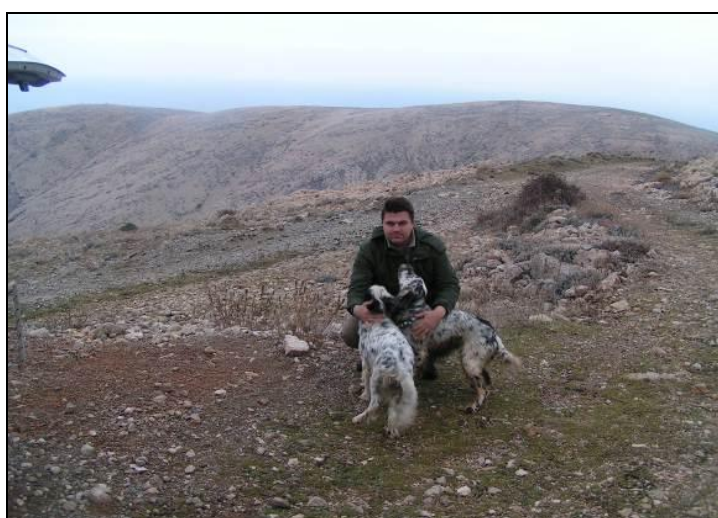
Slika 17: Pogled na jugozapadni dio otoka Krka- lovište VIII/17 Punat