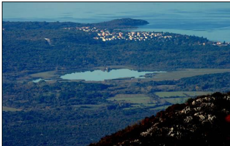
Slika 9: Pogled na otok Krk iz Fužina - lovište VIII/101 Krk