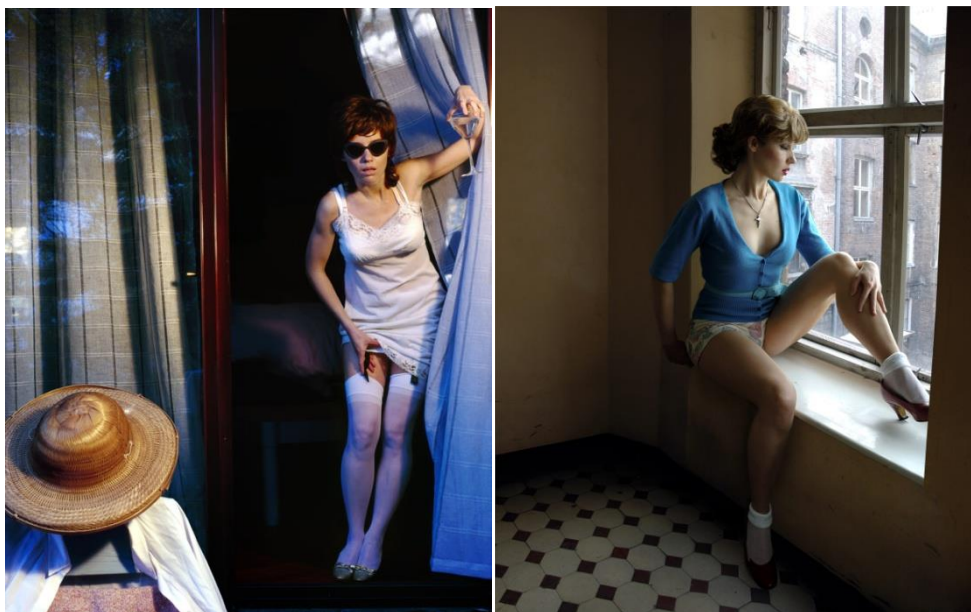
Aneta Grzeszykowska Untitled Film Stills (2006.)