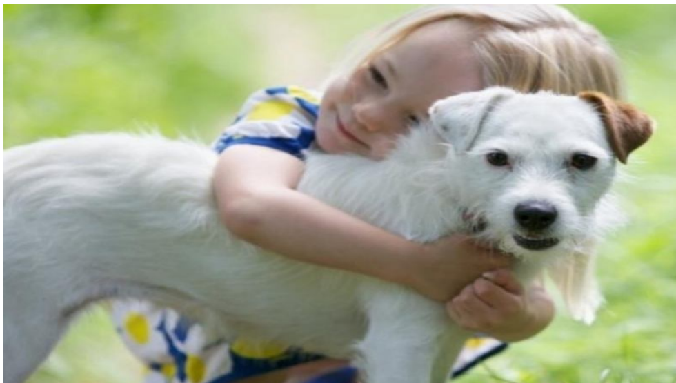
Slika 1. Pas je čovjekov najbolji prijatelj, izvor www.VetMedZg.eu pristup stranici:

Individualnu selekciju pasa s ciljem dobivanja željenih pasminskih osobina, čovjek je provodio od davnina. Za daljnji pripust bi ostavljao jedinke koje bi udovoljavale njegovim potrebama, a izlučivao one s nepoželjnim osobinama. Rezultat toga je da danas na svijetu postoji preko četiristo poznatih pasmina pasa. Stoga se s pravom može reći da danas svatko može izabrati pasminu koja najbolje odgovara njegovim potrebama i željama.