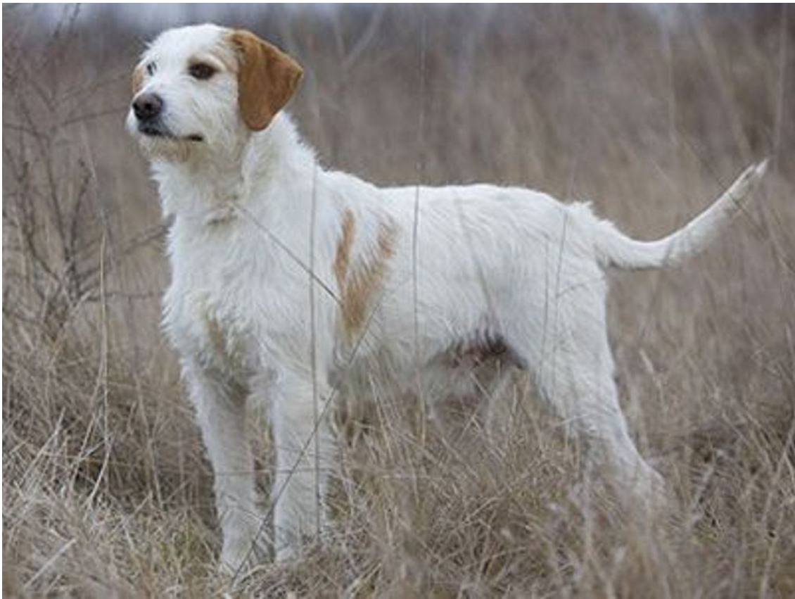
Slika 5. Istarski oštrolaki gonič