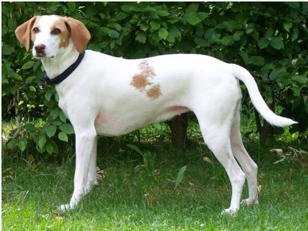
Slika 2. Istarski kratkodlaki gonič, izvor: www.wikipedija.org pristup stranici: 17.05.2017. u 10:20 sati

istarskog oštrodlakog goniča objavio 1949. godine. Prvi standard ove pasmine pasa datira iz 1969. godine, a danas važeći standard objavljen je 03. studenog 2014. godine.