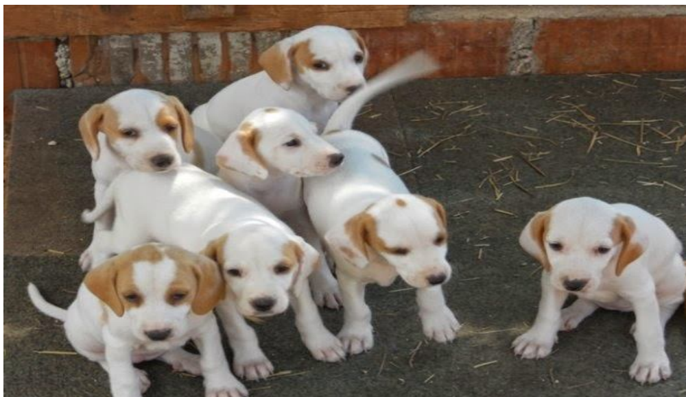
Slika 7. Štenci kratkodlakog varijeteta, pristup stranici: 17.05.2017. u 10:35 sati