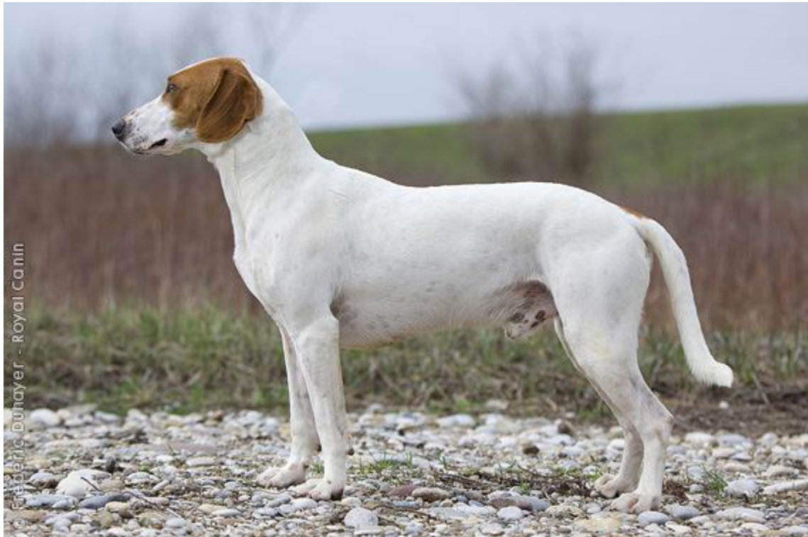
Slika 3. Istarski kratkodlaki gonič, izvor: www.rujanajeger.com pristup stranici: 17.05.2017. u 10:30 sati