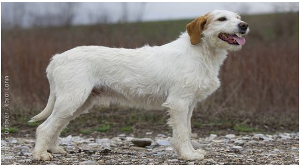
Slika 4. Istarski oštrodlaki gonič, izvor: www.rujanajeger.com pristup stranici: 17.05.2017. u 10:30 sati