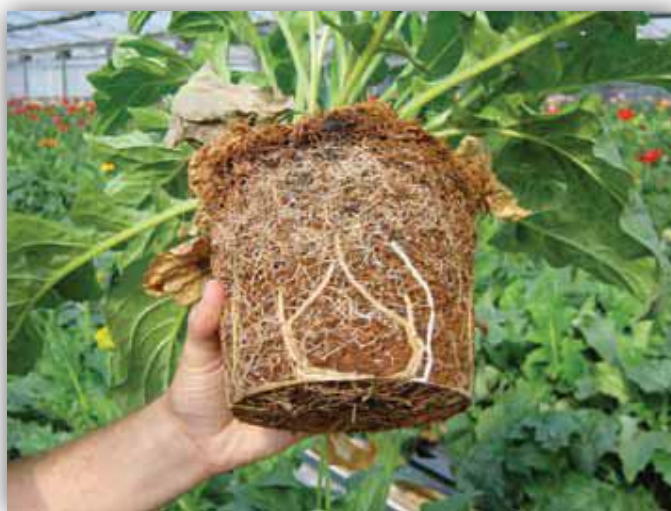
Slika 15. – Formirani korijen gerbera u kokosovom supstratu