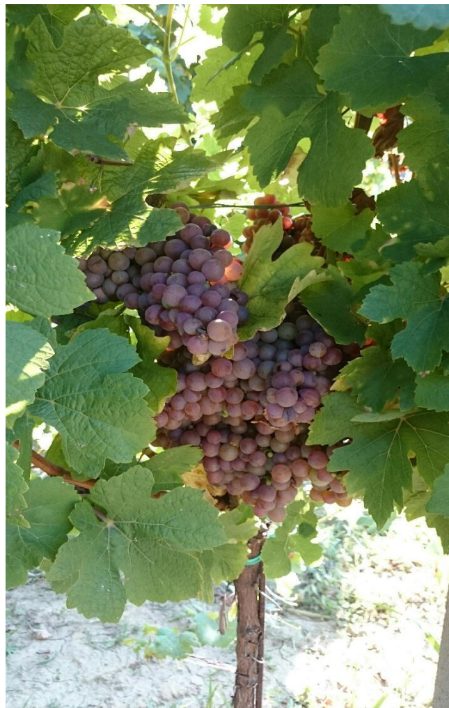
Slika 5. Traminac mirisavi (Mato Drenjančević)

Dozrijevanje je ranije ili u srednje doba. Mehanizirana berba otežana je zbog zgusnute nepravilne vegetacije, smještaja grozdova i težeg odvajanja bobica od peteljčice. Umjerene je otpornosti na gljivične bolesti, a manje je otporna protiv nekih štetnika. Dobro podnosi niske zimske temperature. Vино je slamnato žute boje s većim sadržajem alkohola, specifične arome, harmonično, mekano, vrlo fino.