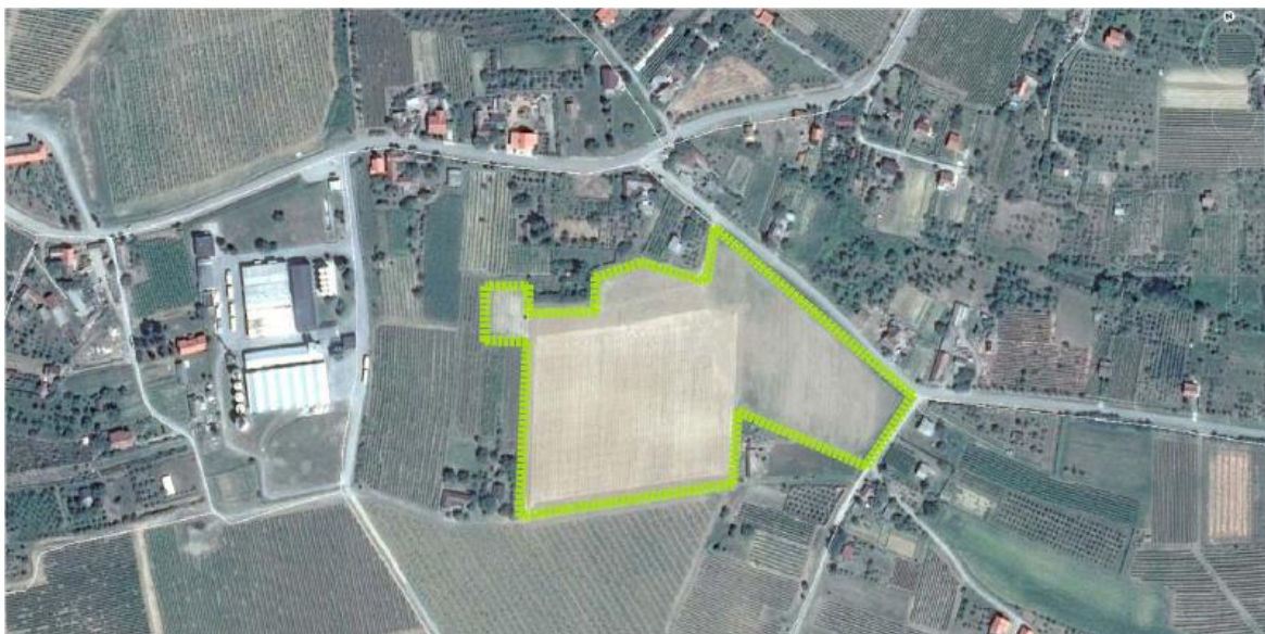
Slika 3. PokušališteMandićevac – snimka iz zraka

Vinograd na kojemu je postavljen pokus smješten je na lokaciji Mandićevac koja se nalazi u blizini vinarije Đakovačka vina d.d. s istočne strane; površine 3,3570 ha, nepravilnog poligonalnog oblika, južne ekspozicije s generalnim padom W→ E od 9,8 %. Ukupna pokusna površina je 14534 m 2 . Međuredni razmak je 2,2 m, a unutar reda 0,8 m.