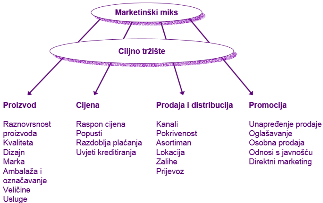
Slika6. Konceptija marketing miksa

Pod pojmom marketinški miks podrazumijeva se specifična kombinacija elemenata koji se koriste za istovremeno postizanje ciljeva poduzeća i zadovoljavanje potreba i želja ciljnih tržišta.