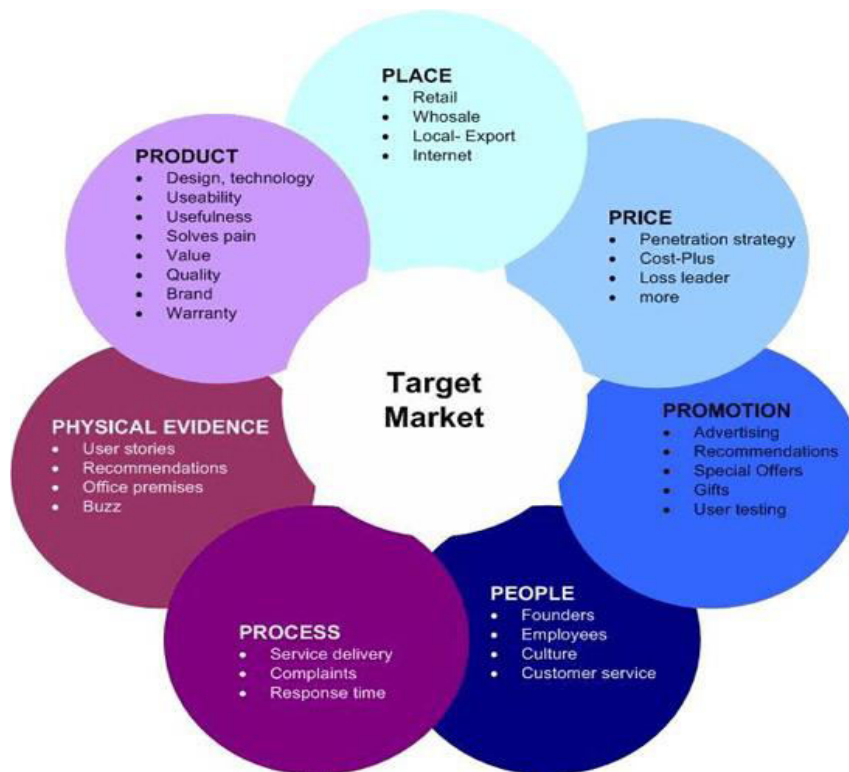
Slika 7. Elementi marketing mix-a 7p