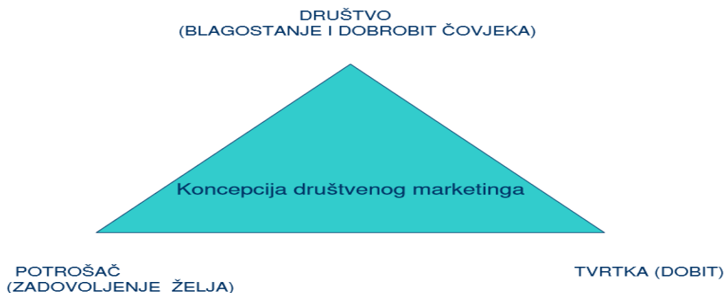
Slika 2. Koncepcija društvenog marketinga

Koncepcija se razvila kao rezultat potrebe uklanjanja konflikata između kratkoročnih želja potrošača i dugoročne dobrobiti potrošača. Upravljanje marketingom treba težiti uravnoteženju triju elemenata: profita poduzeća, potreba i želja potrošača i zahtjeva društva gospodarski subjekt treba utvrditi potrebe, želje i interese ciljnog tržišta te dostaviti traženo zadovoljstvo efektivnije i efikasnije od konkurenata tako da se održava ili unaprijedi dobrobit potrošača i društva. 4