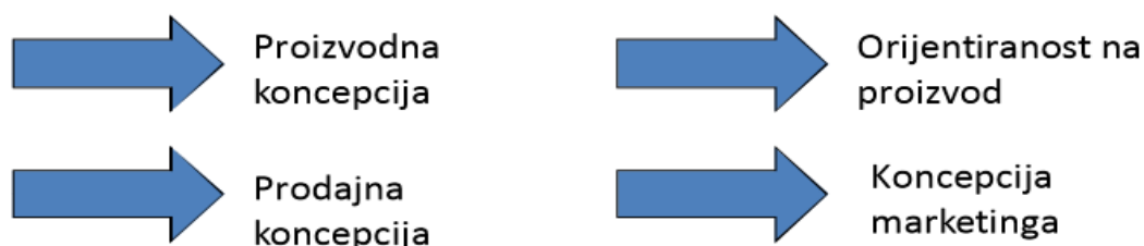
Slika 1. Ključne poslovne orijentacije

1920-ih i 1930-ih razvija se marketing kao posljedica dijeljenja koncepcija menadžementa na distribuciju i prodaju. Razlikujemo nekoliko ključnih poslovnih orijentacija ili koncepcija: Proizvodna, koncepcija proizvoda, prodajna, marketinška i društvena koncepcija marketinga.