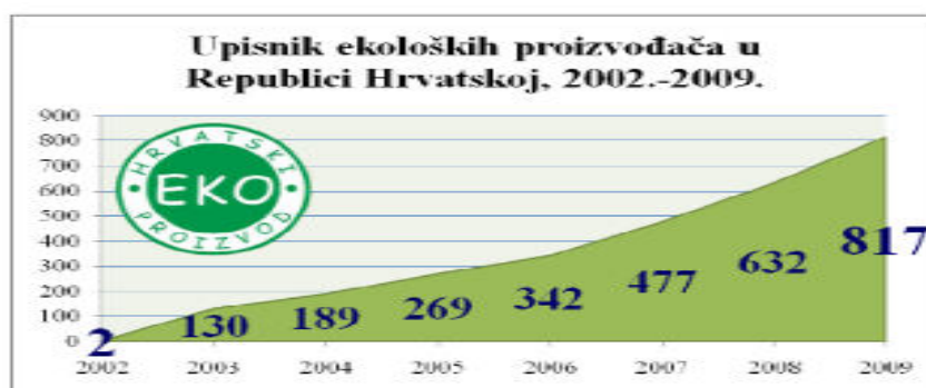
Slika 3. Ekološki proizvođači RH 2002.-2009.

Ekološka proizvodnja definira se kao poseban sustav održivoga gospodarenja u poljoprivredi i šumarstvu koji obuhvaća uzgoj bilja i životinja, proizvodnju hrane, sirovina i prirodnih vlakana te preradu primarnih proizvoda, a uključuje sve ekološki, gospodarski i društveno opravdane proizvodno-tehnološke metode, zahvate i sustave. 10 Najpovoljnije koristi plodnost tla i raspoložive vode, prirodna svojstva biljaka, životinja i krajobraza, povećanje prinosa i otpornosti biljaka s pomoću prirodnih sila i zakona, uz propisanu uporabu gnojiva, sredstava za zaštitu bilja i životinja, sukladno međunarodno usvojenim normama i načelima. Svrha je ekološke proizvodnje zaštita zdravlja i života ljudi, zaštita prirode i okoliša te zaštita potrošača.