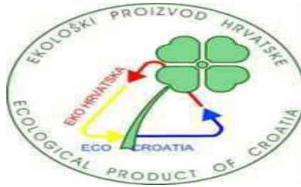
Slika 8. Znak ekološkog proizvoda