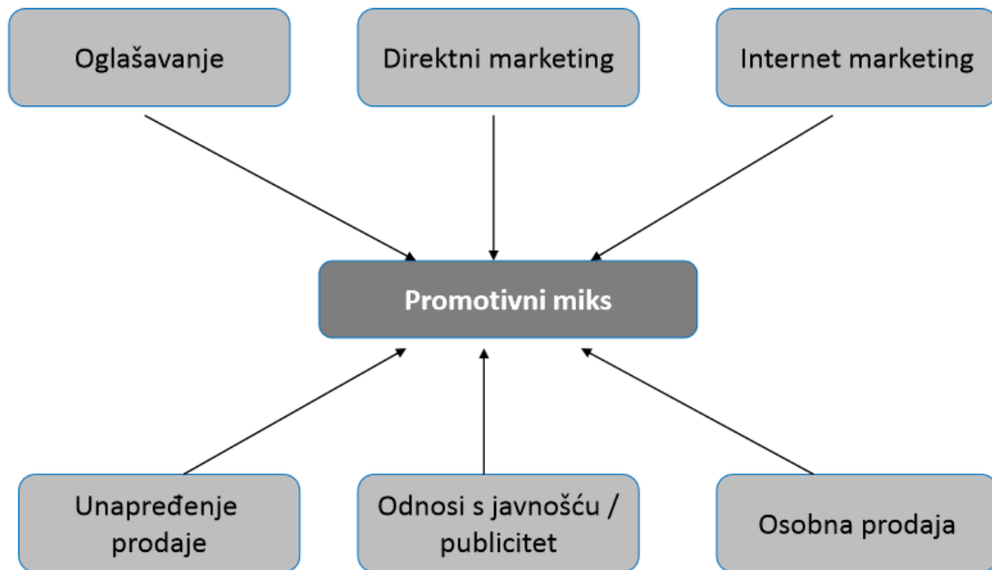
Slika 9. Elementi promotivnog miksa