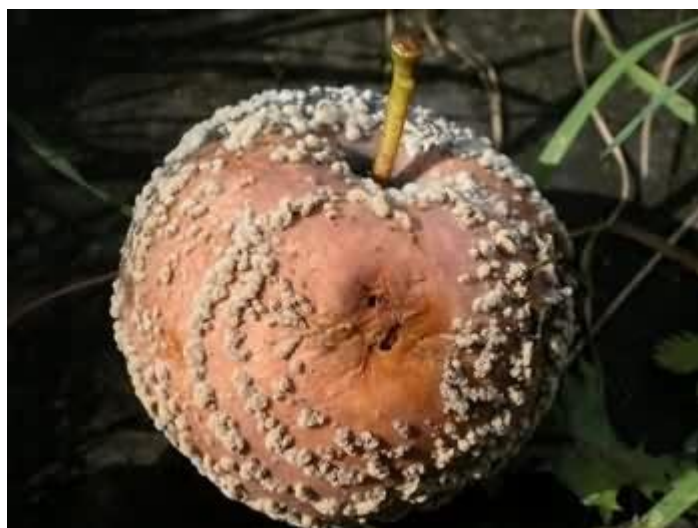
Slika 9. Tipični koncentrični krugovi na zaraženom plodu

Gljivica prezimi u plodovima kao micelij te se u proljeće iz micelija razvijaju jastučići koji sadrže konidije koje se pomoću vjetra, kiše ili insekata prenose na mlade i zrele plodove uzrokujući male i smeđe lezije koje postepeno prekrivaju cijelu površinu kože ploda. Nakon prezimljenja na mumificiranim plodovima mogu nastati apoteciji s askusima i askosporama. Askospore mogu obaviti primarne zaraze, ali je formiranje apotecija, askusa i askospora rijetko pa je konidijski stadij puno značajniji. Konidije kliju u začetak micelija koji prodire u plod najčešće kroz rane. Gljiva raste intercelularno, uzrokuje maceraciju i posmeđenje napadnutog tkiva. Sekundarnu zarazu vrše konidije koje nastaju na plodovima koje su primarno zaraženi, a primarnu zarazu vrše konidije prošlogodišnjih mumificiranih plodova. Najčešći napad je u lipnju i srpnju (Cvjetković, 2010.).