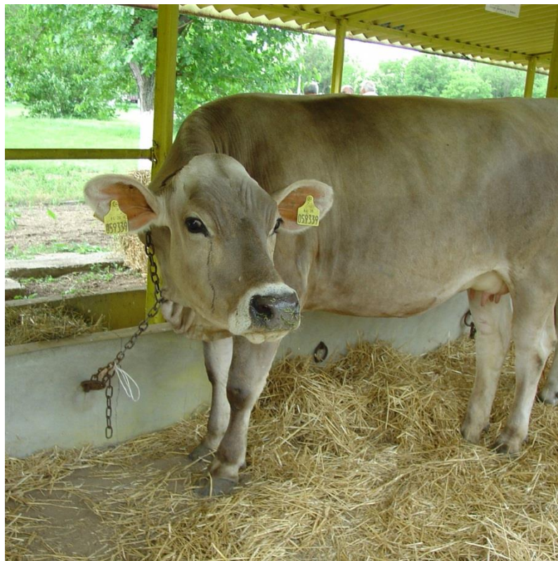
Slika 11. Smeđe alpsko govedo