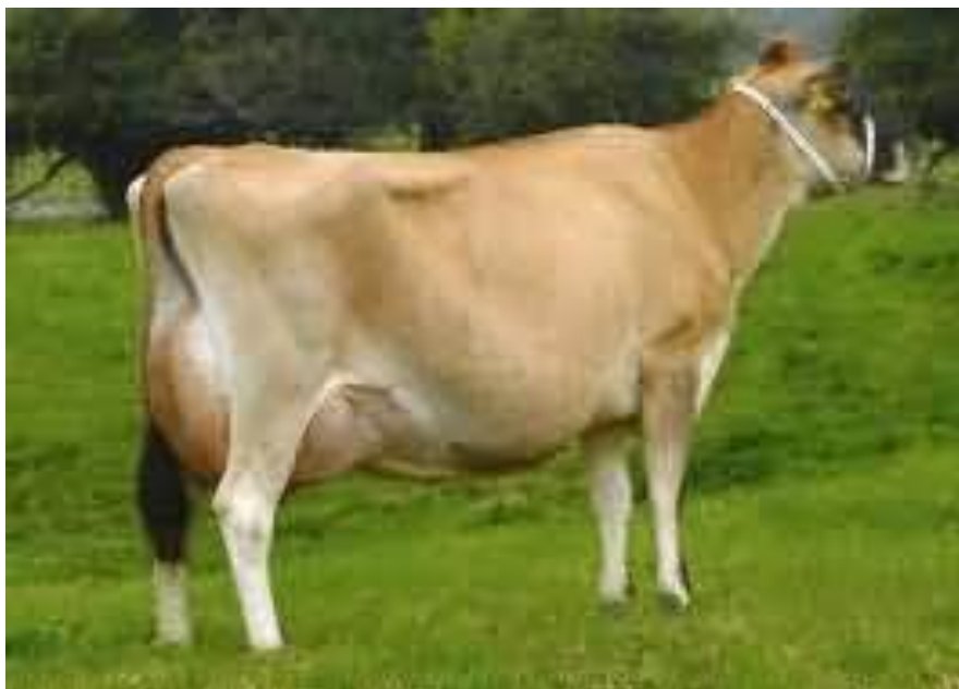
Slika 10. Jersey pasmina