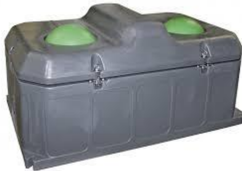
Slika 12. pojilica

U svakoj štali ugrađenje su 2 plastične pojilice koje imaju 2 otvora prekrivena kuglom. Funkcioniraju tako da krave dođu do pojilice i njuškom gurnu kuglu unutra da bi došle do vode. U pojilice je ugrađen plovak i kad voda padne do određenog nivoa ona se automatski sama počene puniti.