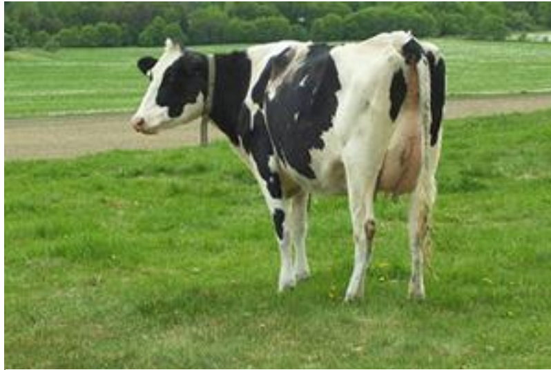
Slika 9. Holstein pasmina