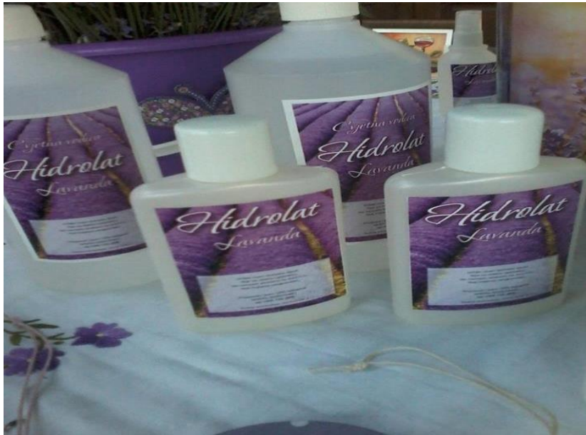
Slika 10. Cvjetna vodica ili hidrolat od lavande

Hidrolat od lavande je cvjetna vodica nastala kao nusprodukt destilacije lavandinog ulja. Ima slična svojstva kao ulje ali slabije djeluje od ulja. Razlog tome je to što ima manju količinu ulja. Najčešće se koristi kao tonik u kozmetici.