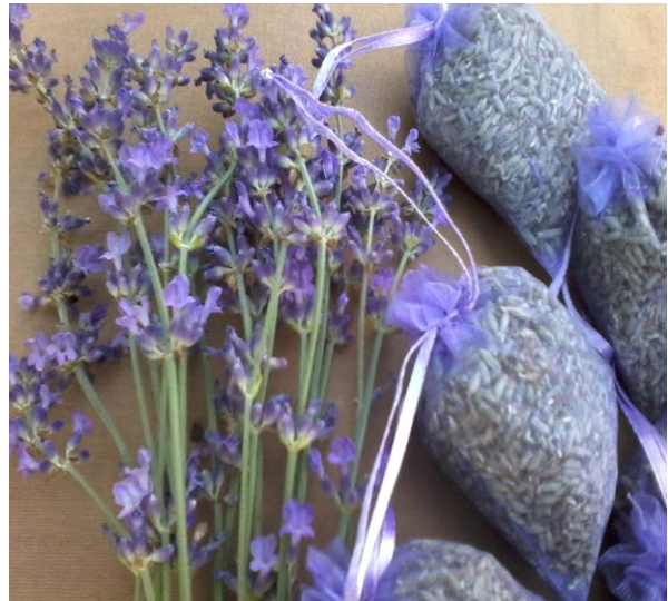
Slika 7 i 8. Suhi cvijet u vrećicama

Ulje ima također umirujuća svojstva, neke od "čudesnih" svojstava, osim umirujućeg djelovanja, su to da smanjuju probleme sa kožnim iritacijama, manjim opekotinama, opekotinama od sunca i . Također će pomoći kod ugriza kukaca i modrica te pomoći će tako i kod zacjeljenja te kod opuštanja napetih mišića.