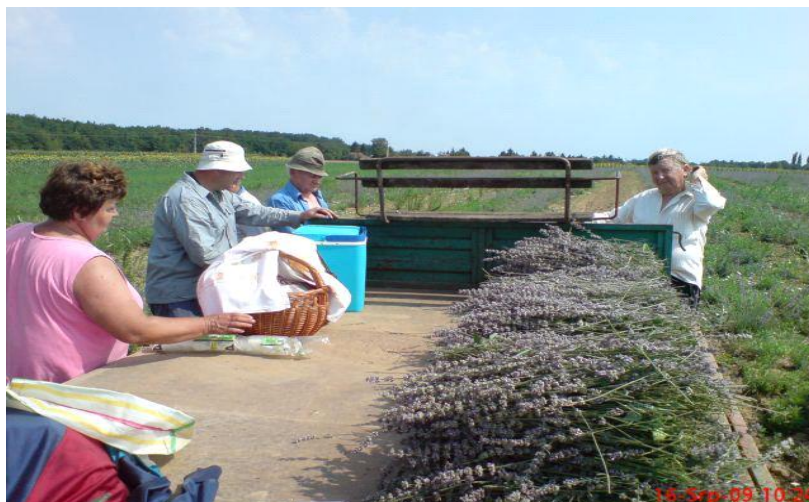
Slika 6. Slaganje ubranih cvjetova lavande na prikolicu

Glavni proizvodi lavande je ulje. Od jednog odrasli grm lavande (3 godine i više) ima prinos od 1 kg svježeg cvijeta. Prosječni prinos eteričnog ulja je 1,5% eteričnog ulja po grmu, to je oko 15 grama. Na jednom hektaru na kojem je posađena lavanda nalazi se oko 8.000 tisuća grmova.