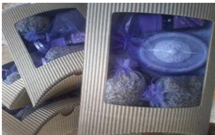
Slika 12. Poklon paket sa proizvodima sa OPG-a Sabadoš

U promociji proizvoda im je pomogla stranica na društvenoj mreži Facebook gdje redovno stavljaju slike svojih proizvoda, a redovno objavljuju zanimljive podatke o ljekovitim svojstvima lavande te zanimljivosti vezane uz nju. Za vrlo kratko vrijeme krajnji kupci, zapravo građani Vukovara i okoline saznali su za proizvode od lavande koja se proizvodi u okolini i bili su vrlo zainteresirani na samom početku proizvodnje te nije bilo potrebe za velikim aktivnostima pri promoviranju proizvoda na OPG-u Sabadoš.