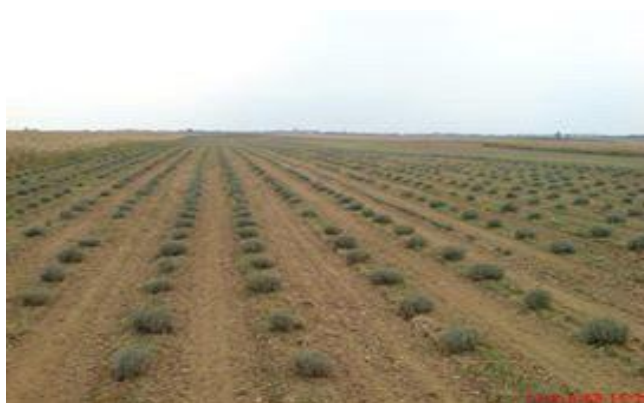
Slika 2. Lavanda godinu dana nakon sjetve