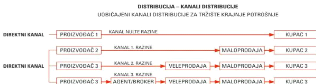
Slika 14. Uobičajeni kanali distribucije za tržište krajnje potrošnje ( Izvor:

Poduzeće mora odlučiti je li će proizvod prodavati direktno krajnjim potrošačima (direktni kanal distribucije), preko posrednika (indirektna distribucija). Ako se odluči da ne prodaje svoje proizvode indirektno krajnjim korisnicima, kompanija mora da izabere posrednike – vrstu i broj posrednika (posrednici u distribuciji, marketinški posrednici). (Igor Protić, Marketing i trgovina; Beograd 2013, str 8).