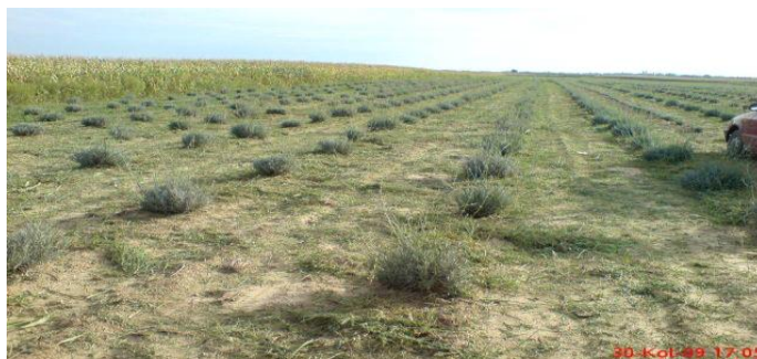
Slika 1. Lavanada godinu dana nakon sjetve

biljka veća, ima i veću cijenu. Presadnice lavandina za proljetnu sadnju imaju i do 30 % nižu cijenu u odnosu na one namijenjene za sadnju u jesen. Na OPG-u Sabadoš sadnice su nabavili su od OPG-u Vera Trampus iz Belišća koji se bavi uzgojem sadnica. Cijena presadnica je bila 5 kn po komadu (srednje razvijene sadnice). Hibridna lavanda se sadi na razmak među redovima 180 ili 200 cm, a unutar reda 50 – 60 cm, uz sklop 9.200 – 10.000 sadnica po hektaru.