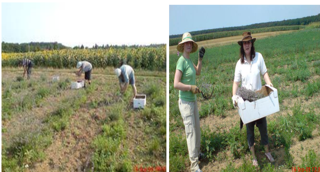
Slika 4 i 5: Branje cvijeta na OPG-u Sabadoš