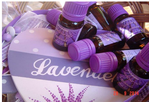
Slika 9. Ulja od lavande u pakiranju od 10 ml

Ulje ima također umirujuća svojstva, neke od "čudesnih" svojstava, osim umirujućeg djelovanja, su to da smanjuju probleme sa kožnim iritacijama, manjim opekotinama, opekotinama od sunca i . Također će pomoći kod ugriza kukaca i modrica te pomoći će tako i kod zacjeljenja te kod opuštanja napetih mišića.