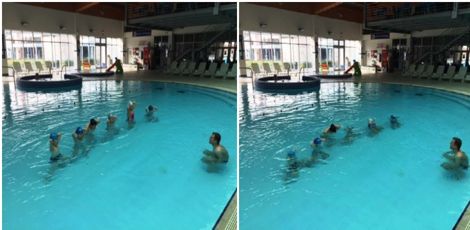
Slika 3. i 4. Disanje u mjestu. Lijeva slika (3): početna pozicija s rukama postavljenim iza glave. Desna slika (4): izvedba disanja u mjestu.