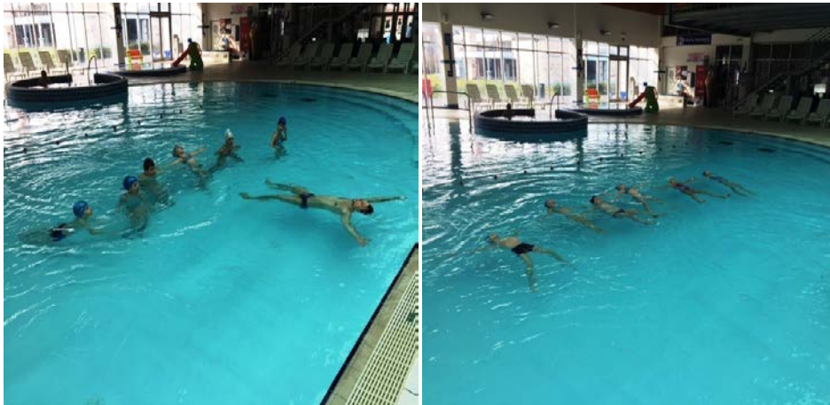
Slika 5 i 6. Plutanje na leđima. Lijeva slika (5): trener demonstrira plutanje na leđima. Desna slika (5): djeca izvode plutanje na leđima.

odličan (5)- samostalno zauzima položaj plutanja na leđima 10 i više sekundi.