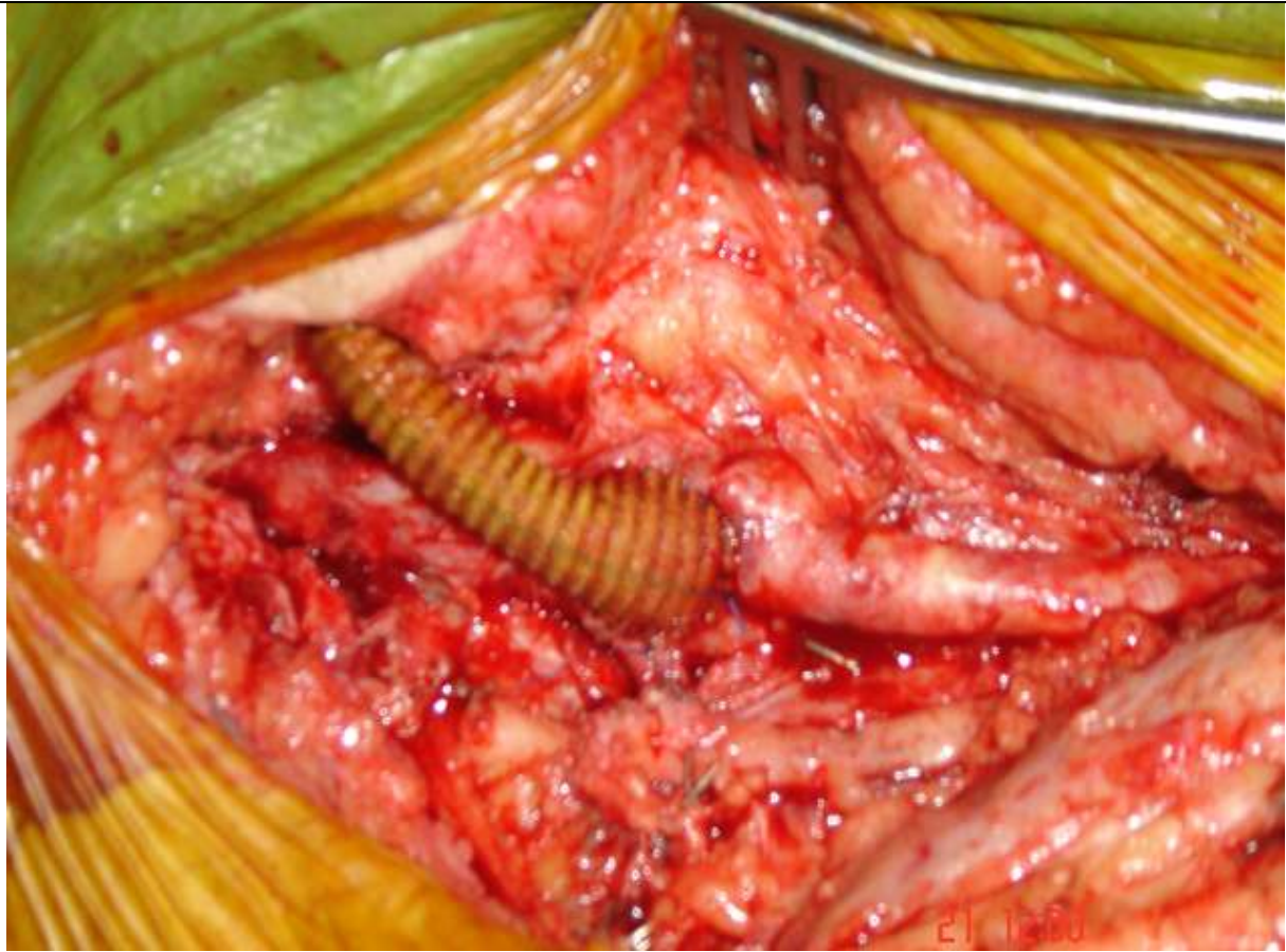
Slika 2 - Anastomoza ekstraanatomske femorofemoralne prenosnice.