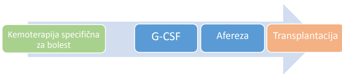
Slika 1. Steady-state mobilizacija

Filgrastim se aplicira u dnevnoj dozi od 10 \mu\text{g} / \text{kg} / \text{dan} kao jedna supkutana injekcija 5 do 7 uzastopnih dana dok se lenograstim primjenjuje 4 do 6 dana. Budući da uporabom „steady-state“ mobilizacije broj CD34+ stanica u PK doseže zenit između 4. i 6. dana od početka primjene, nadzor nad tom vrijednošću trebao bi započeti 4. ili 5. dan protokola. Leukafereza se učini 5. ili 6. dan primjene (filgrastim), odnosno između 5. i 7. dana (lenograstim). Također, sve više podataka govori u prilog uspješnosti 12 mg pegfilgrastima kao jedne supkutane doze. Međutim, pegfilgrastim još nije široko prihvaćen od transplantacijskih centara, što se može pripisati uhodanoj i pouzdanoj uporabi G-CSF-a i cijeni preparata (Mohty et al. 2014, Duong et al. 2014).