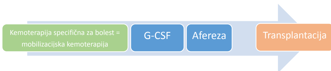
Slika 3. Primarna terapija kao kemomobilizacija

Suprotno tome, kod pacijenata s (relapsiranim) limfomom zasebna G/C se izbjegava zbog dodatnog opterećenja ciklusima kemoterapije. Stoga se kod tih pacijenata jedan od ciklusa primarne kemoterapije iskorištava kao mobilizacijski ciklus (Ozkan et al. 2014, Zhou et al 2015).