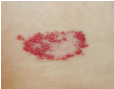
Slika 4. Involucijska faza površnog hemangioma djetinjstva

Tipično vrijeme pojave hemangioma djetinjstva je unutar prva 4 tjedna života. Proliferativna faza može trajati do kraja prve godine života djeteta premda njihov rast počinje između 1. i 2. mjeseca života. Površni hemangiomi 80% svoje veličine dosežu do 3. mjeseca, a kod većine rast je završen oko 5. mjeseca života. Otkrivaju se lokaliziranim bljedilom kože ili makularnim teleangiektatičnim eritemom. Proliferacijom endotelne stanice hemangiom raste, podiže se iznad razine kože i dobiva svoj karakterističan izgled. Tijekom tog procesa hemangiomi često imaju blijedu zonu koju ih okružuje te dilatirane okolne vene. Duboki hemangiomi otkrivaju se nešto kasnije i rastu nešto duže od onih površnih (slika 4).