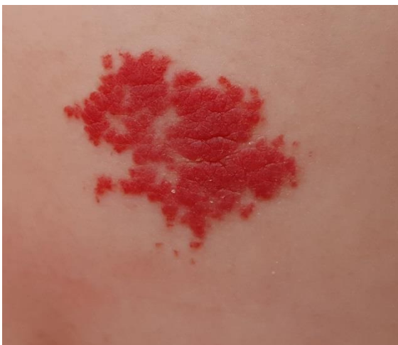
Slika 2. Površni hemangiom djetinjstva

Korištenje različitog nazivlja za hemangiome djetinjstva rezultiralo je ogromnom dijagnostičkom zbrkom. Nazivima kapilarni hemangiom i kapilarni angiom označavali su se hemangiomi djetinjstva svijetlo crvene boje smješteni primarno u dermisu (slika 2).