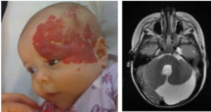
Slika 7. Dijagnostika PHACE sindroma magnetskom rezonancijom

Dijagnoza hemangioma djetinjstva uglavnom se postavlja temeljem anamneze i kliničke slike. Slikovne metode potrebne su u stanjima nesigurne dijagnoze, procjene ekstenzivnosti tumora, praćenja efekata terapije to kod dijagnosticiranih sindroma (slika 7).