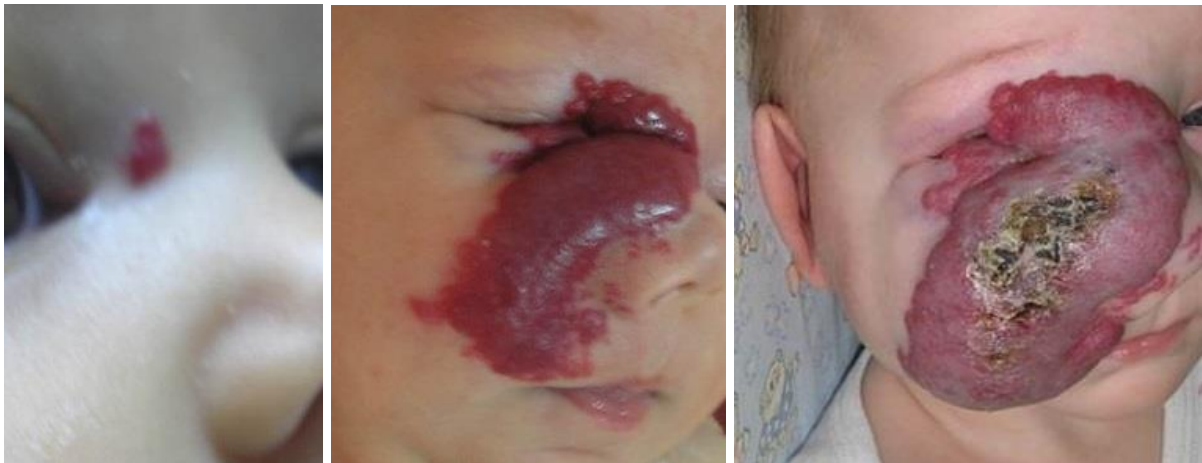
Slika 3. Razvoj hemangioma djetinjstva kroz proliferativnu fazu

Rana proliferativna faza hemangioma karakterizirana je dobro ograničenom lobularnom masom kapilara omeđenom endotelnim i perivaskularnim stanicama ugrađenim unutar bazalne membrane, ali bez pridruženih glatkih mišićnih stanica. Budući su u proliferativnoj fazi tipični visoki protoci krvi, premda bez značajnog arterio-venskog shuntinga, oni često sadrže povećane drenažne vene debelih asimetričnih stijenki (slika 3).