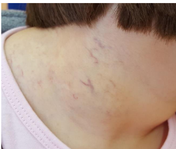
Slika 10. Rezidualne teleangiektazije nakon terapije hemangioma propranololom

Rani tretman u estetskim zonama lica može reducirati i izliječiti površne hemangiome omogućujući povratak normalnog izgleda kože i prevenciju nastanka atrofičnog ožiljka ponekad prisutnog nakon involucije (Waner et al. 1994). Područje vrška nosa i lice zone su na kojima uklanjanje hemangiomom zahvaćene kože može ostaviti neželjene ožiljke. Stoga se ranim tretmanom PDL laserom može sačuvati koža kao režanj za pristup kasnijem operacijskom zahvatu uklanjanja ostataka hemangioma na navedenim regijama (slika 10).