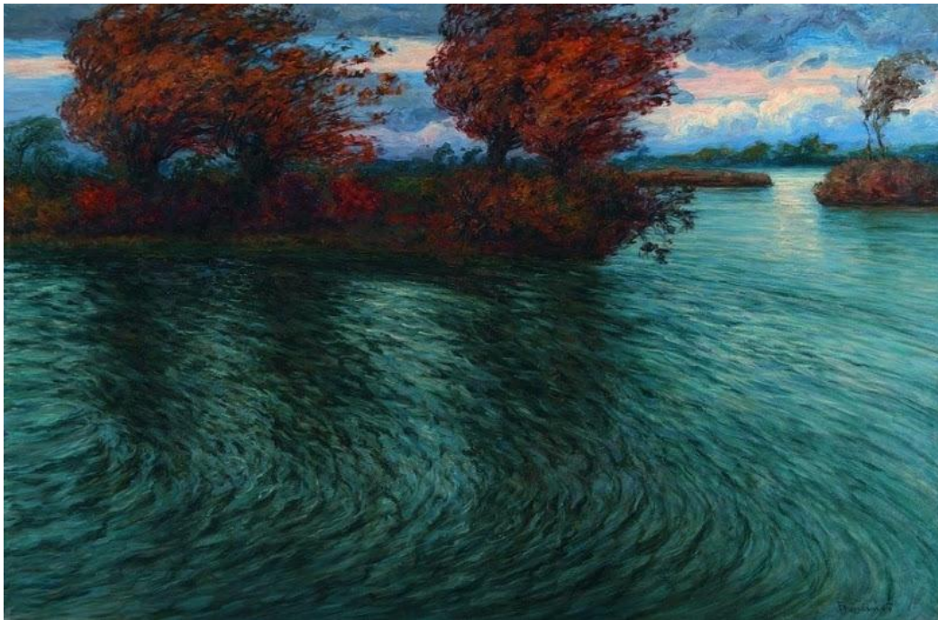
Slika 17. Ferdo Kovačević. Bura , 1910.

Bukovčev pointilizam, a od 1905. pa na dalje njegova djela odlikuju se raznolikošću fakture i usredotočenošću na riječni krajolik. I slike i studije radio je u prirodi i nije ih doradivao u ateljeu, a njegovim pejzažima prethodili su veliki pripremni radovi. Stoga se u njegovoj ostavštini nalazi dosta crteža, pastela, studija u ulju i skica koje dokazuju faze njegova rada. 1905. naslikao je »Zimski suton«, jedan od prvih zimskih pejzaža, a uz njega, između ostalih slika i »Vrbik na Savi«, za koju Kružić-Uchytíl piše kako je vrhunski domet slikareve rane faze i primjer našeg zakašnjelog impresionizma. U razdoblju od 1906. do 1915. godine kolorit mu je raznolik, kao i faktura koju prilagođava slikanim elementima i osvjetljenju. Tako slika »U predvečerje« iz 1908. obiluje tamnoljubičastim nijansama, »Zadnji sunčani traci« iz 1909. skalom toplih boja, »Na savskom rukavu« iz 1909. svjetlosnim refleksima, a djelo »Bura« iz 1910. i »Pred olujom« iz 1913. predstavljaju ga kao jedinstvenog slikara atmosfere. (Kružić-Uchytíl, 1986)