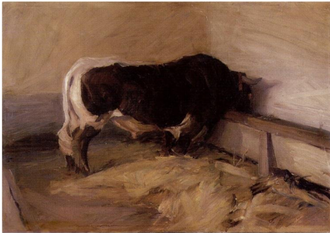
Slika 23. Miroslav Kraljević. Bik , 1910.

München je u to vrijeme veliko središte u kojem su se križala različita strujanja i različiti umjetnički utjecaji koje prepoznajemo u Kraljevićevim djelima. Jedan od takvih utjecaja, kako smatra naša kritika povijesti umjetnosti, dolazi od umjetnikova prijatelja, animalista Rudolfa Schramm-Zitaua, a utjecaj se očituje u Kraljevićevim djelima seoske ikonografije. Animalistički motivi kojima je umjetnik bio izložen tijekom praznika donose nam djela »Bik«, »Krave na paši«, »Bijeli konj«. Djela u kojima koristi širok i gust potez kista, koji ga odvaja od tonskog stupnjevanja, a približava tonskom kontrastiranju. Spomenuto djelo »Bik« iz 1910. godine, Kraljević slika alla prima 39 načinom izdvajajući pojedinosti životinjske anatomije, ekspresivno nanesenim gustim potezima. Umjetnik se koncentrirao na impresionističko rješenje likovnog problema u oblikovanju prostora što ga izdvaja od dotadašnjih hrvatskih plenearista. (Gamulin, 1995)