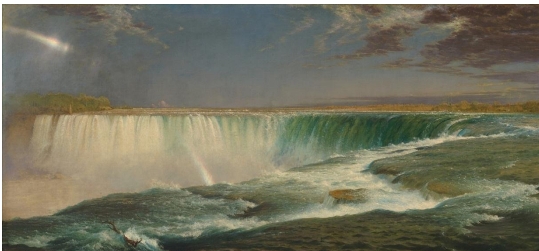
Slika 9. Frederic Edwin Church. Niagarini slapovi , 1857. Corcoran Gallery of Art, Washington, DC.