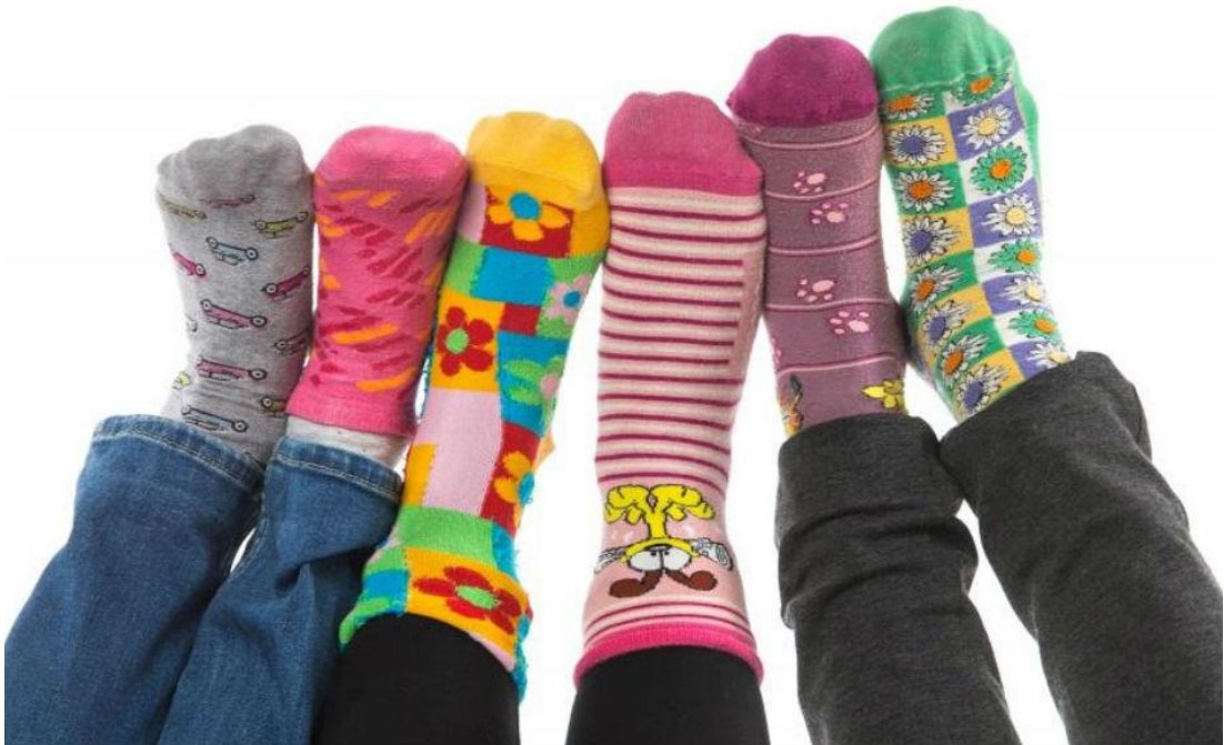
Slika 12. Simbol dana Down sindroma

Simbol dana Down sindroma su šarene čarape jer ih osobe s Down sindromom ne mogu upariti. Nošenjem šarenih čarapa pokazuje se podrška borbi osoba s Down sindromom kako bi se što bolje integrirali u naše društvo.