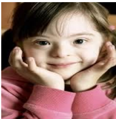
Slika 3. Karakterističan izgled osobe s Down sindromom