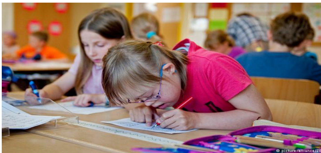
Slika 7. Djeca s Down sindromom u redovnoj školi

Imaju različitu fonološku svijest. Oni uče čuti i vidjeti slova te ih povezivati. Proces fonološke svjesnosti je duži nego kod ostale djece najčešće zbog teškoća sa sluhom. Potrebno je slovati i kroz razne igre i metode usvajati foneme. Prilikom učenja čitanja i pisanja s razumijevanjem djeca s Down sindromom ponekad neće razumijeti pročitano te im je zbog toga potrebno omogućiti postepeno ovladavanje.