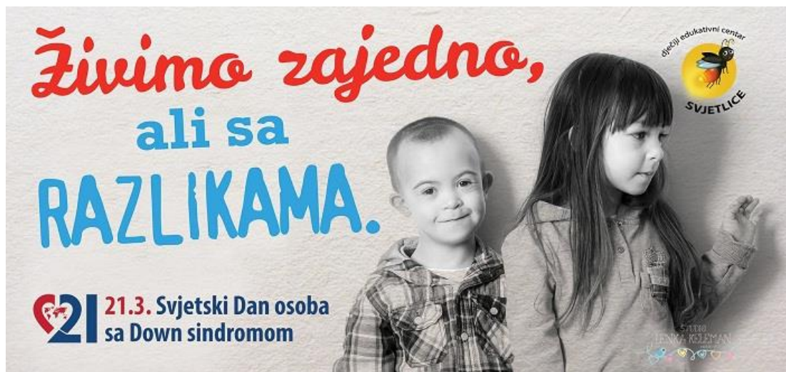
Slika 11. Svjetski dan osoba s Down sindromom

Ujedinjeni narodi (UN) su prihvatile predloženu rezoluciju i 10. studenog 2011. godine donijele odluku da se 21. ožujka obilježava kao Međunarodni dan Down sindroma . Usvajanjem odluke UN je iskazao svoju podršku zaštiti prava osoba s Down sindromom u cijelom svijetu, posebice zemljama u razvoju.