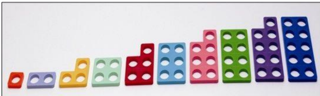
Slika 7. Numicon pomagalo

može obogatiti edukativnim materijalima i pomagalima. Sve više djece s Down sindromom u RH koriste Numicon pomagalo. Numicon pomagalo pomaže da nauče i vizualno povežu količine i tako shvate matematičke operacije.