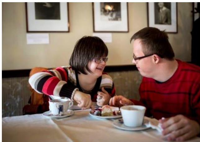
Slika 4. Osobe s Down sindromom u adolescenciji

U razdoblju adolescencije roditelji trebaju proći fazu prilagodbe kao i djeca te savladavati nova znanja i vještine zajedno sa djecom.