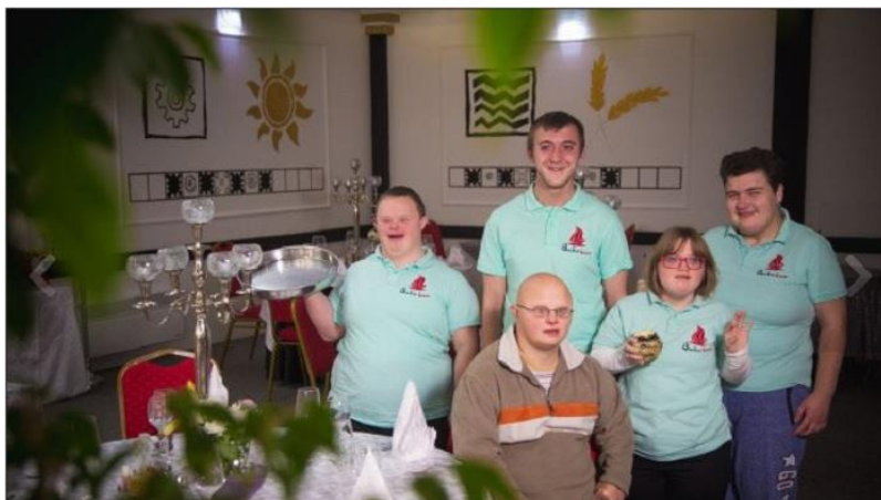
Slika 8. Članovi udruge „Bubamara“