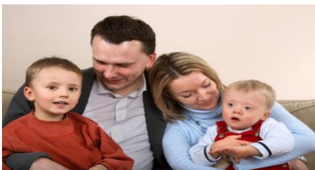
Slika 10. Down sindrom u obitelji

Djetetu s Down sindromom potrebna je ljubav kao i svoj drugoj djeci, potrebna im je obitelj koja im pruža poštivanje i ljubav kao što i oni njoj pružaju. Priručnik „ DOWNOV SINDROM u obitelji “ sadrži niz vrijednih ideja koje su na jednostavan način predstavljene i jasno opisane za primjenu.