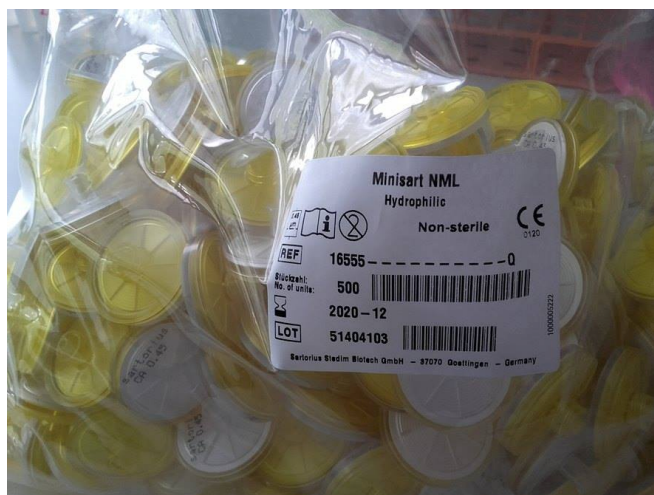
Slika 2. Filteri Minisart NML

Uzorci su filtrirani jednokratnim filterima (Slika 2.) ubrizgavajući otopinu špricama NORM-JECT zapremnine 5ml.