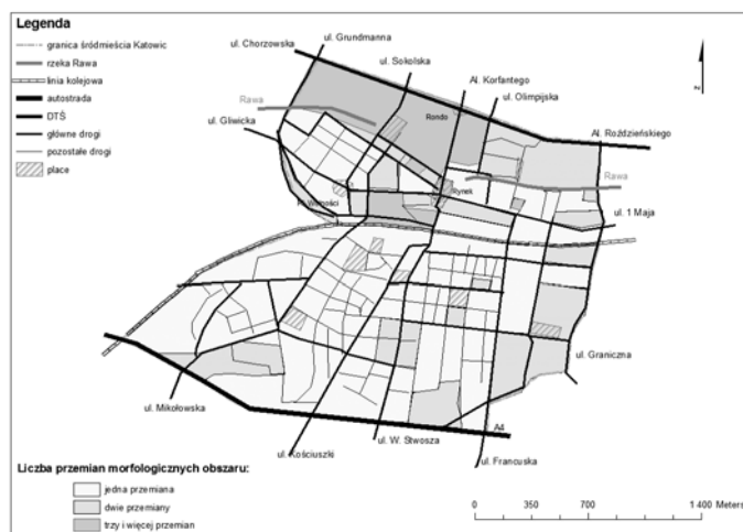
Rys. 3. Częstość występowania przemian morfologicznych w śródmieściu Katowic. Fig. 3. Frequency of morphological changes of the city centre of Katowice.

fologiczny uznać należy szlaki komunikacyjne. Najstarsze z nich pochodzą co najmniej z XVIII w. i są zachowane do dziś praktycznie w nie zmienionym kształcie (nie licząc modernizacji). Również te wytyczone w późniejszych etapach są stosunkowo trwałe, przebudowie ulegały jedynie najważniejsze arterie, które najczęściej poszerzano aby zwiększyć ich przepustowość. Istotnym, trwałym elementem morfologii miasta jest linia kolejowa, która niezmiennie od połowy XIX w. dzieli Katowice na dwie części. Mniej trwałe okazały się linie wąskotorowe, które jeszcze w drugiej połowie XX w. występowały zwłaszcza w północnej części śródmieścia i zniknęły wraz z zanikiem funkcji przemysłowych. Śladem po kolei wąskotorowej we współczesnym krajobrazie miasta są stosunkowo nowe ul. M. Geppert-Mayer i ul. Grundmanna, które przebiegają dawną trasą tej kolejki.