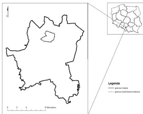
Rys. 1. Lokalizacja śródmieścia Katowic Fig. 1. Location of the city centre of Katowice

Obszarem badawczym jest śródmieście Katowic – miasta położonego na południu Polski, stolicy województwa śląskiego. Według podziału administracyjnego miasta na dzielnice, Śródmieście jest częścią zespołu dzielnic śródmiejskich i obejmuje obszar między ulicami Chorzowską i Roździeńskiego na północy, ulicami Dudy-Gracza, Graniczą i Sowińskiego na wschodzie, autostradą A4 na południu oraz linią kolejową i ulicą Grundmanna na zachodzie (rys. 1). Obszar ten w dużej mierze pokrywa się z pierwotnymi granicami miasta Katowice, przyjętymi w 1865r. wraz z uzyskaniem praw miejskich, w których znalazły się trzy historyczne osady – Kuźnica Bogucka, wieś Katowice i folwark Karbowa.