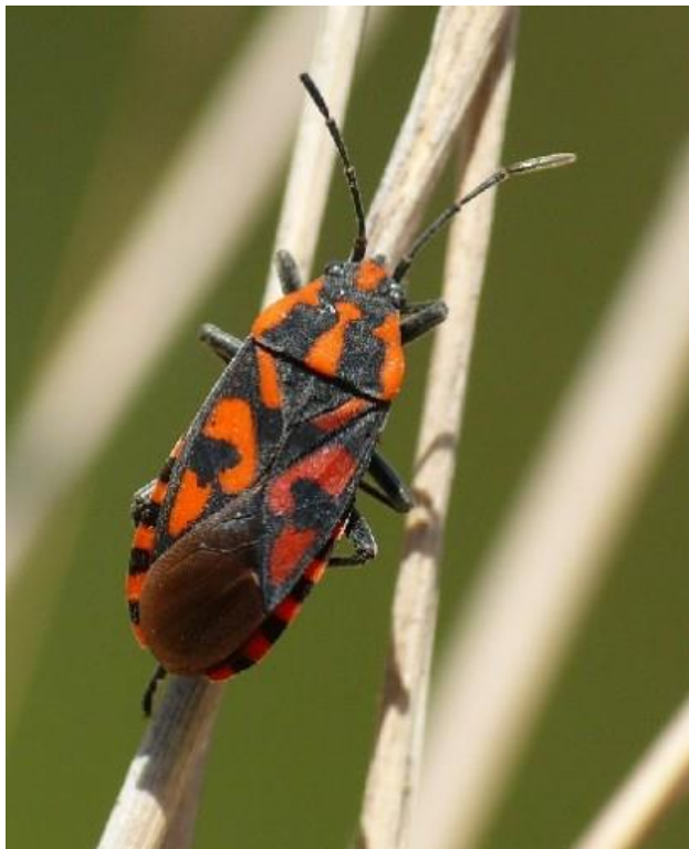
Ryc. 1. Spilostethus saxatilis zaobserwowany w Dąbrowie Górniczej. [ Fig. 1. Spilostethus saxatilis observed in Dąbrowa Górnicza].

Rodzaj Spilostethus Stål, 1868, w Europie reprezentowany przez cztery gatunki, w Polsce posiada tylko jednego przedstawiciela - Spilostethus saxatilis (Scopoli, 1763) (Péricart 2001).