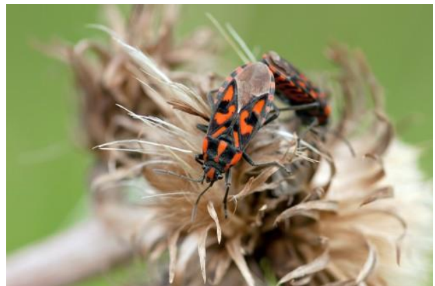
Rys. 2. Spilostethus saxatilis zaobserwowany w Sławkowie [ Fig. 2. Spilostethus saxatilis observed in Sławków].

Ten charakterystycznie ubarwiony pluskwiak (ryc. 1, 2) jest polifagiem związanym pokarmowo z roślinnością zielną, najczęściej obserwowanym na roślinach z rodziny Asteraceae ( Senecio sp., Tanacetum sp., Tragopogon sp.) oraz Apiaceae ( Heracleum sp., Daucus sp., Pastinaca sp.) (Wachmann i in. 2007).