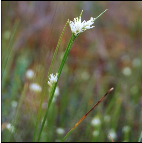
Fot. 2. Przygiełka biała Rhynchospora alba

Фот. 2. Очеретник белый Rhynchospora alba