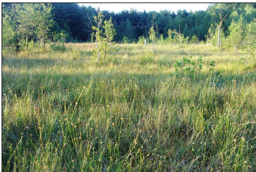
Fot. 1. Użytek ekologiczny „Przygiełka”