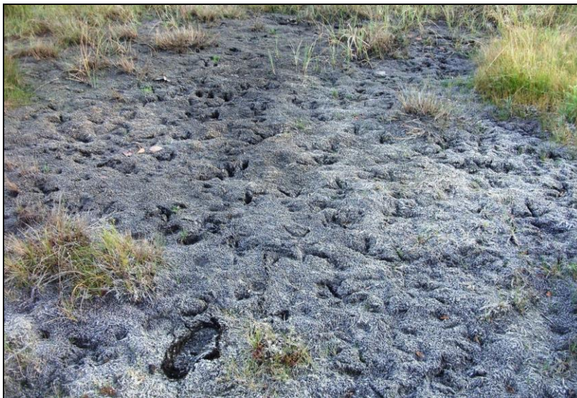
Fot. 6. Osuszony fragment torfowiska w miejscu występowania stagnującej wody z płatem Nymphaeetum candidae

Photo 5. The example of damaged surface of the „Przygiełka” peat-bog