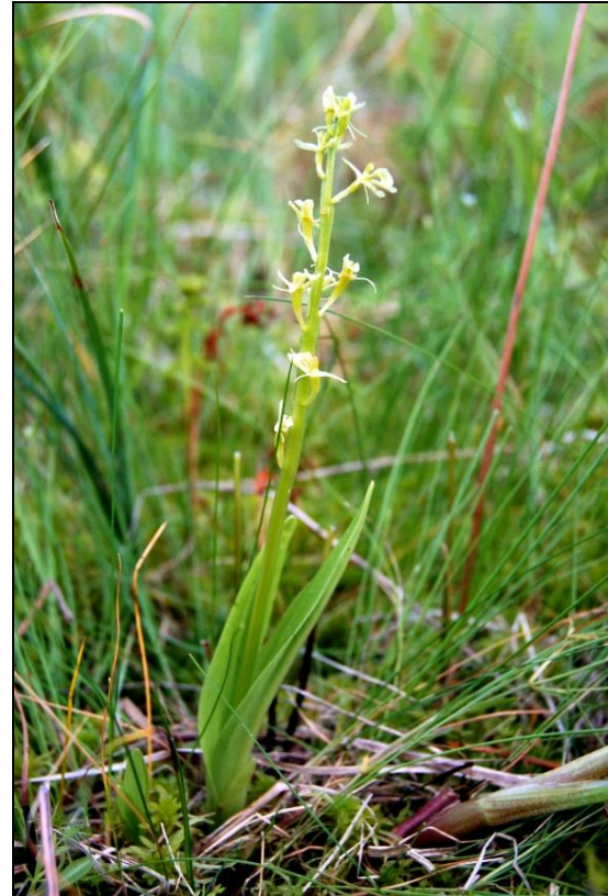
Fot. 3. Lipiennik Loesela Liparis loeselii

Фот. 3. Липарис Лезеля Liparis loeselii