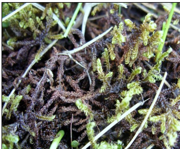
Fot. 4. Haczykowiec błyszczący Hamatocaulis vernicosus

Występowanie na tym terenie lipiennika Loesela i haczykowca błyszczącego (fot. 4), czyli gatunków ujętych w Dyrektywie siedliskowej... (1992), a także zbiorowisk roślinnych będących identyfikatorami siedlisk Natura 2000, takich jak: 3150 – starorzecza i naturalne eutroficzne zbiorniki wodne ze zbiorowiskami z Nympheion, Potamion , 7140 – torfowiska przejściowe i trzęsawiska przeważnie z roślinnością z Scheuchzeria-Caricetea nigrae , 7230 – górskie i nizinne torfowiska zasadowe o charakterze młak, turzycowisk i mechowisk, nadają „Przygielce” znaczenie o wymiarze europejskim.