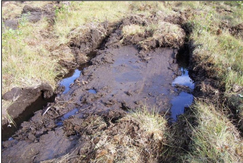
Fot. 5. Przykład zniszczonej powierzchni torfowiska „Przygiełka”

Фот. 5. Пример повреждения поверхности торфяника „Пшигелка”