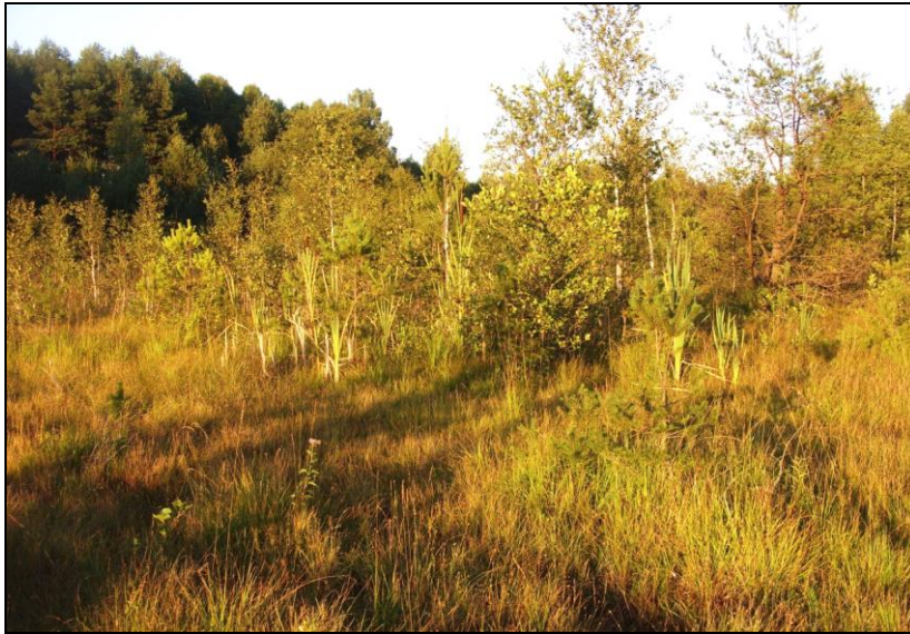
Fot. 7. Zarastanie użytku ekologicznego „Przygiełka” Фот. 7. Зарастание экологического пользования „Пшигелка” Photo 7. Overgrowing of „Przygiełka” ecological site