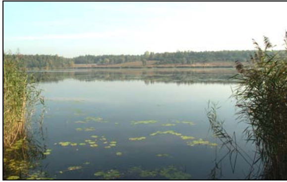
Fot. 2. Zbiornik Pogoria II – użytek ekologiczny – walory estetyczne i ekologiczne Photo 2. Pogoria II water reservoir – ecological land – aesthetic and ecological values