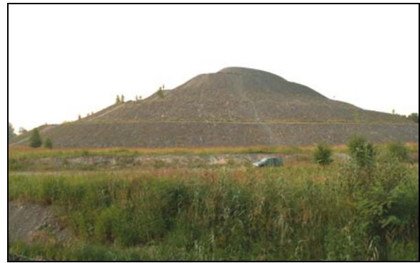
Fot. 5. Zwałowisko skały płonnej w Bieruniu – walory rekreacyjne Photo 5. Spoil tip in Bieruń – recreational values

Do rekreacji służą również tereny piaskowni czy zwałowisk zrehabilitowane w kierunku leśnym. I tak np. w Bieruniu specjalnie dla celów wypoczynkowych i rekreacyjnych ukształtowano zwałowiska skały płonnej w postaci różnej wysokości kopców, które mają pełnić rolę punktów widokowych (SZCZYPEK, 2003; PEŁKA-GOŚCINIAK, 2007) (fot.5).