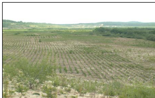
Fot. 1. Piaskownia w Bukownie – rekultywacja w kierunku leśnym – walory estetyczne, rekreacyjne i poznawcze (fot. J. Pelka-Gościniak, 2010)

Również rekultywacja w kierunku wodnym „poprawia” krajobraz (fot. 2). W okresie letnim zbiorniki stają się miejscem „wytchnienia” dla mieszkańców miast i okolicznych miejscowości. Nie tylko korzystnie wpływają na percepcję krajobrazu, ale są również miejscem dla poszukujących ucieczki od rozgrzanych miejskich budynków (KASZTELEWICZ, 2010).