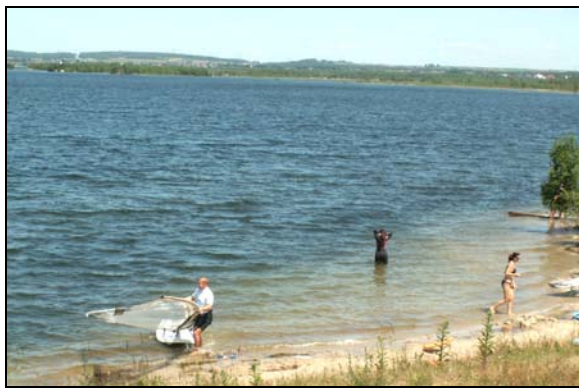
Fot. 3. Zbiornik Kuźnica Warężyńska – walory rekreacyjne Photo 3. Kuźnica Warężyńska water reservoir – recreational values