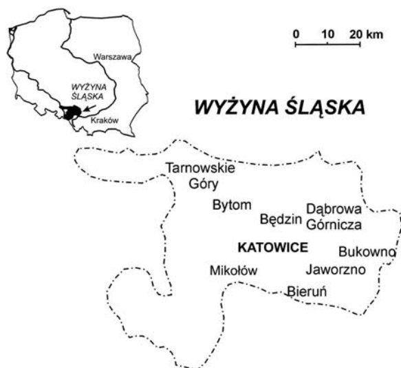
Rys. 1. Lokalizacja obszaru badań Fig. 1. Location of study area