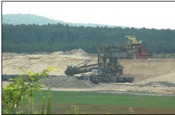
Fot. 6. Piaskownia Jaworzno-Szczakowa – aktywne pole eksploatacji piasku podsadzkowego. Na zboczach widoczne efekty naturalnych procesów morfogenetycznych. Photo 6. Sandpit Jaworzno-Szczakowa – active field of exploitation of stowing sand. At slopes are visible effects of natural morphogenetic processes – cognitive values

cyjnych form rzeźby, a także rozwój unikatowej wydmy krawędziowej (SZCZYPEK, WACH, 1991, 1993 a, b). Obecnie jedynie w niewielkiej, południowej części piaskowni między Biskupim Borem a Podlesiem można zauważyć procesy eoliczne (fot. 6), natomiast na większości terenu widać spektakularne efekty celowych procesów naprawczych – rekultywacyjnych czy też naturalnej sukcesji (fot. 1). Można zatem powiedzieć, że piaskownie to naturalne, świetnie wyposażone laboratoria terenowe (SZCZYPEK, SNYTKO, 1998; PEŁKA-GOŚCINIĄK, 2007). Do wartości poznawczych i ekologicznych należy również rozwój roślinności, będącej efektem naturalnej sukcesji (FIJAŁKOWSKA, SZCZYPEK, WACH, 2010).