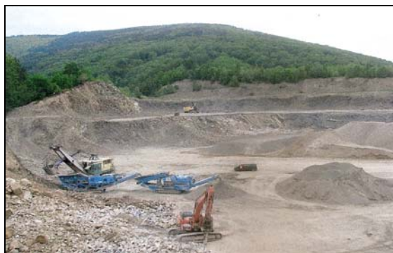
Fot. 1. Wyrobisko wgłębno-stokowe Photo 1. Hillside quarry

Kopalnia Surowców Skalnych „Wisła” S.A. obejmuje wzgórze o wysokości 550 m n.p.m., które jest częścią ramienia Wielkiej Czantorii (997 m n.p.m.). Administracyjnie teren ten położony w województwie śląskim, powiecie cieszyńskim, w granicach miast Wisła i Ustroń. Kopalnia znajduje się w otulinie Parku Krajobrazowego Beskidu Śląskiego. Teren kopalni obejmuje 34,4476 ha powierzchni. Wyrobisko ma charakter wgłębno-stokowy (fot. 1 i 2). W wyniku eksploatacji wzgórze zostało obniżone, co miało bezpośredni wpływ na zmianę powierzchni terenu. Piaskowce budujące złożę „Oblaziec-Gahura” należą do warstw godulskich dolnych. W przeszłości eksploatacja odbywała się w dwóch kamieniołomach – Oblaziec (E) oraz Gahura (W); obecnie kamieniołomy te są połączone.