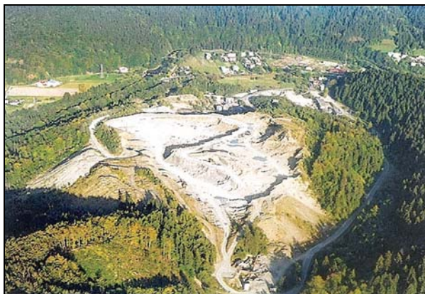
Fot. 2. Widok KSS „Wisła” z lotu ptaka (www.ksswisla.pl) Photo. 2. Bird's eye view of KSS „Wisła” (www.ksswisla.pl)

W wyniku odsłonięcia warstw skalnych widoczna jest budowa geologiczna. Występują tu dwie odmiany piaskowców z górnej kredy, zróżnicowane cyklicznością sedimentacyjną (fot. 3). Są to cienko- i gruboławicowe serie piaskowca z wkładkami łupków ilastych. Piaskowce gruboławicowe znajdują się w południowej części kamieniołomu, natomiast cienkoławicowe – w północnej. Ich miąższość sięga od 1 do 7 m (gruboławicowe) oraz od 5 cm do 50 cm (cienkoławicowe). W kierunku północnym grubość ławic piaskowca zmniejsza się i zaczynają pojawiać się wkładki ilaste, których miąższość w niektórych miejscach dochodzi nawet do 0,5 m (BOMBA, 2009).