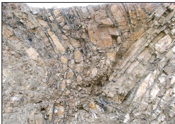
Fot. 3. Piaskowce godulskie w KSS „Wisła” Photo 3. Godula sandstones in KKS „Wisła”

W wyniku odsłonięcia warstw skalnych widoczna jest budowa geologiczna. Występują tu dwie odmiany piaskowców z górnej kredy, zróżnicowane cyklicznością sedimentacyjną (fot. 3). Są to cienko- i gruboławicowe serie piaskowca z wkładkami łupków ilastych. Piaskowce gruboławicowe znajdują się w południowej części kamieniołomu, natomiast cienkoławicowe – w północnej. Ich miąższość sięga od 1 do 7 m (gruboławicowe) oraz od 5 cm do 50 cm (cienkoławicowe). W kierunku północnym grubość ławic piaskowca zmniejsza się i zaczynają pojawiać się wkładki ilaste, których miąższość w niektórych miejscach dochodzi nawet do 0,5 m (BOMBA, 2009).