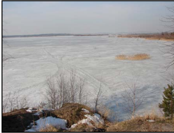
Fot. 2. Ślady użytkowania zamrożonej powierzchni zbiornika Kuźnica Warężyńska Photo. 2. Traces of frozen surface use of Kuźnica Warężyńska reservoir