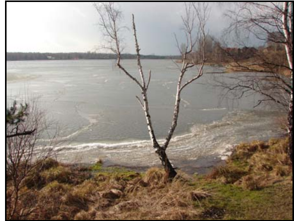
Fot. 3. Spiętrzenia kry i drobnego lodu we wschodnim sektorze zbiornika Pogoria I. Phot. 3. Floe and small ice ridging in the eastern sector of Pogoria I water reservoirs