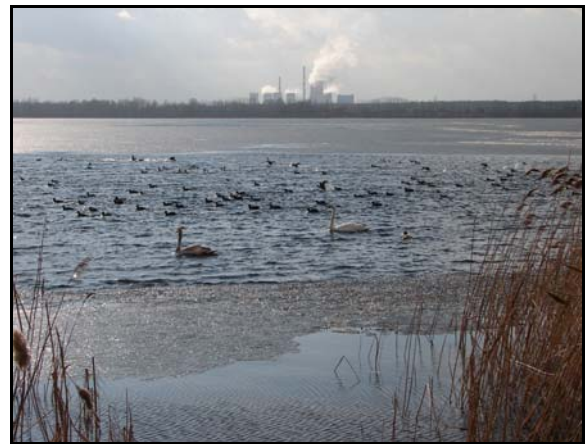
Fot. 4. Zbiornik Pogoria III w okresie zaniku pokrywy lodowej. Photo. 4. Pogoria III water reservoir during ice cover decline

skutkowało utrzymaniem się grubości pokrywy lodowej na niezmiennym poziomie, jednak w jego strukturze były widoczne niewielkie zmiany. Obserwowano kurczenie się lodu krystalicznego na korzyść przyrostu lodu wodno-śnieżnego, przy jednocześnie niezmiennym poziomie wody pomiędzy wspomnianymi warstwami lodu. Dodatkowo temperatury w pierwszej dekadzie marca, niewielkie opady deszczu oraz ciepłe wiatry, osiągające w porywach prędkość dochodzącą do 10,6 m/s, doprowadziły do prawie całkowitej destrukcji zwartej pokrywy lodowej na opisywanych zbiornikach. Dotyczy to szczególnie pierwszego w kaskadzie zbiornika Pogoria I, na którym wiatry zachodnie zepchnęły krę lodową i drobny pokruszony lód w jego wschodnie sektory (fot. 3). Liczne spękania w lodzie, spiętrzenia kry i obecność przestrzeni wolnych od lodu stwierdzono także w zbiorniku Pogoria III (fot. 4). Natomiast w zbiorniku Pogoria II 10 marca nadal występowała zwarta pokrywa lodowa o miąższości 2,0–3,0 cm, której zanik następował symetrycznie