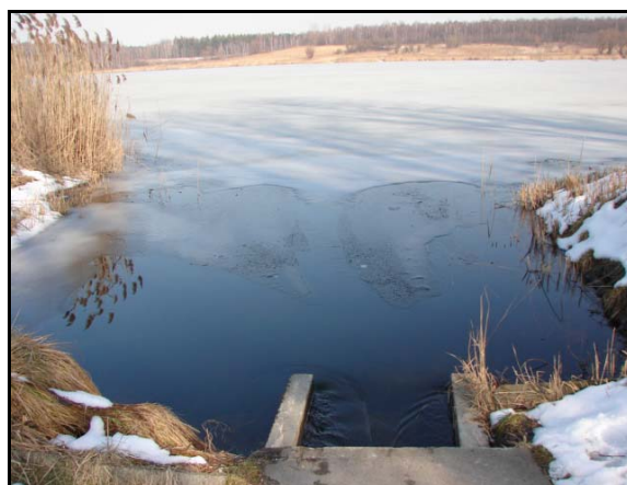
Fot. 1. Wolna od lodu strefa odpływu ze zbiornika Pogoria II.

Początkowe różnice w grubości lodu pomiędzy poszczególnymi zbiornikami zostały wyrównane po około 2 tygodniach od pojawienia się zjawisk lodowych, bowiem 10 stycznia na wszystkich opisywanych akwenach stwierdzono pokrywę lodową o grubości 13 cm, a tylko na zbiorniku Pogoria I jej miąższość była o 0,5 cm większa (tab. 2). W kolejnych dniach miał miejsce systematyczny przyrost grubości lodu, jednak w przypadku Pogorii II tempo to było największe, bowiem w zbiorniku tym miąższość lodu 18 stycznia wynosiła 17 cm, a w pozostałych ukształtowała się na poziomie 15,0–15,5 cm. Od tego momentu aż do 29 stycznia wystąpiło dosyć wyraźnego ocie-