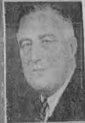
Franklin D. Roosevelt