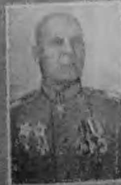
Stanisław Kozłowski, dowódca Wojska Polskiego