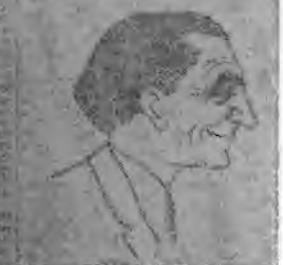
Fot. 14. „Dziennik Polski” 1946, nr 60, s. 5, dod. „Sprawy Słowiańskie”

Z Jambowa... Wzięli w niej udział przedstawiciele z różnych krajów, którzy omówili dotychczasowe osiągnięcia i zadania przed nami.