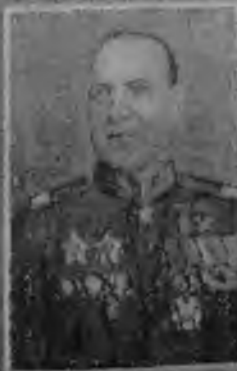
Stanisław Kozłowski, dowódca Wojska Polskiego