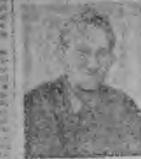
Nowy trener narciarstwa polski