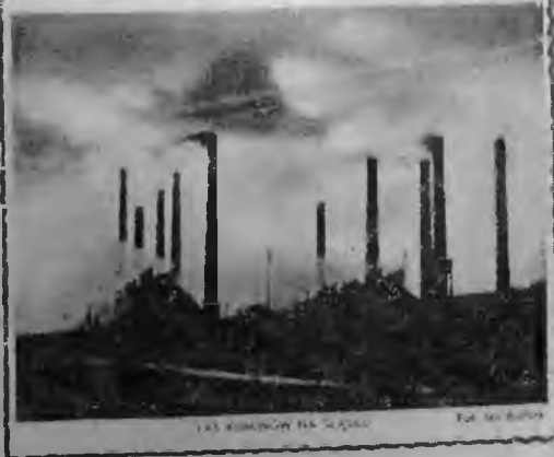
Fot. 10. „Dziennik Polski” 1945, nr 56, dod. „Gazeta Dzieci” nr 1, s. 1