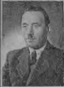
Stanisław Kozłowski, dowódca Wojska Polskiego