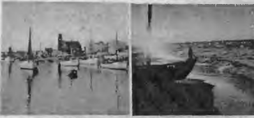
Na wybrzeżu bałtyckim

Wzrost wujci mój a ja... ...moje mały... ...nie było... ...by nowy... ...TWA STELBURG-ZARZĘBKA