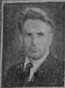
Stanisław Mikulski, prezydent Komendy Głównej Armii Krajowej

Kraków, władztwa dnia (9 lutego 1945) Nr 1