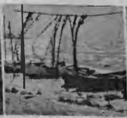
Zachód słońca nad polskim morzem