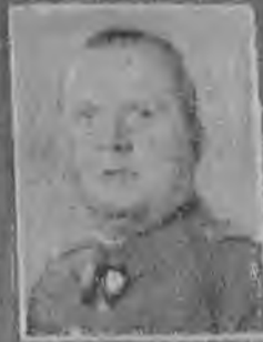
Stanisław Kozłowski, dowódca Wojska Polskiego