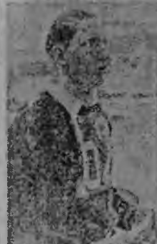
Alura Kasprzyka, zdobywca pucharu

Wspaniałe wrażenie wywarł występ zespołu z Zagłębia, który zagrał kilka niezwykle trudnych utworów. Wspaniałe wrażenie wywarł występ zespołu z Zagłębia, który zagrał kilka niezwykle trudnych utworów.