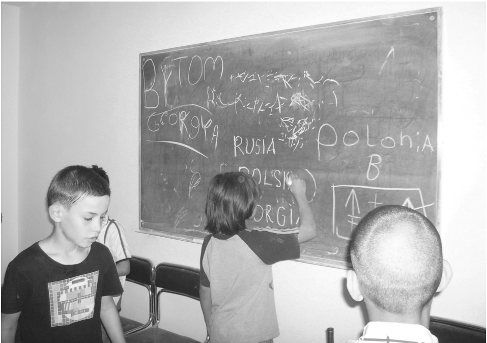
Fot. 2. Ośrodek dla cudzoziemców w Bytomiu — sala szkolna.