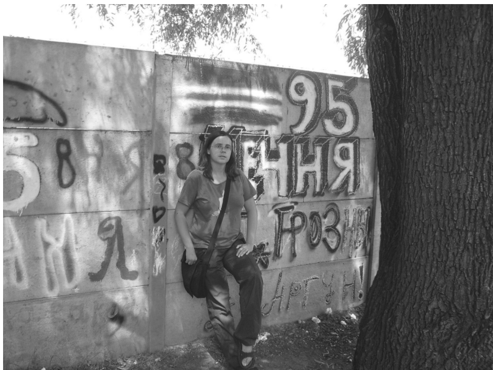
Fot. 3. Ośrodek dla cudzoziemców w Bytomiu — autorka na tle graffiti, stworzonego podczas warsztatów zorganizowanych przez CSW Kronika.

(lub innej formy ochrony) opuścili województwo śląskie. Niewielka część z nich próbowała z mniejszym lub większym powodzeniem usamodzielnić się i rozpocząć życie poza ośrodkiem — przykładowo, w roku szkolnym 2011/2012 w szkole podstawowej w Bytomiu-Stroszku uczyło się kilkoro cudzoziemskich dzieci (brak jest nowszych danych).